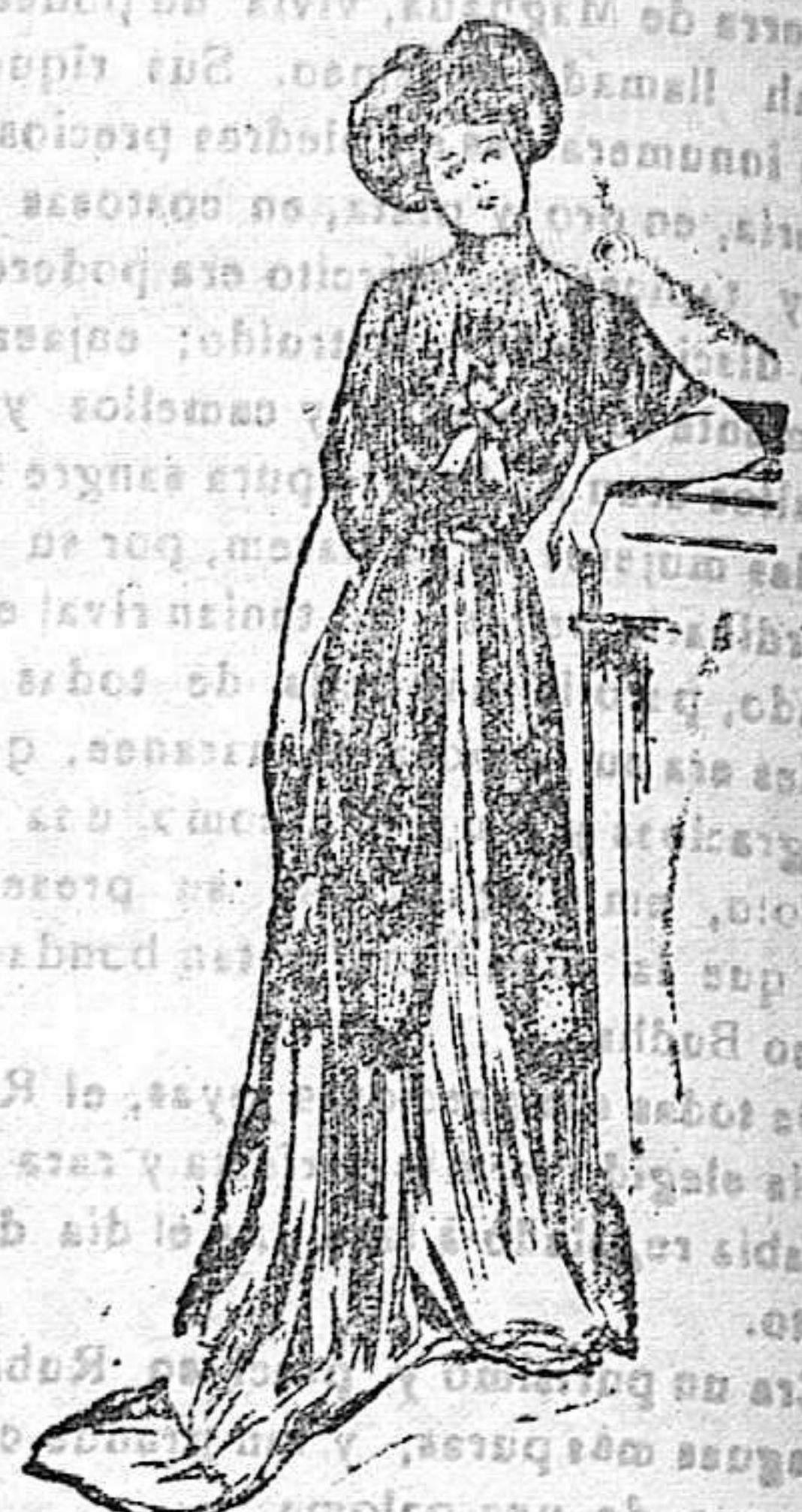
Traje para recibir visitas

La blusa de este modelo es de satin, color rosa, sumamente escotada y abrochada á la cintura por una pata y un botón. A ambos lados del delantero lleva otras dos patas que se abrochan en la parte superior. La manga algo ancha y corta.