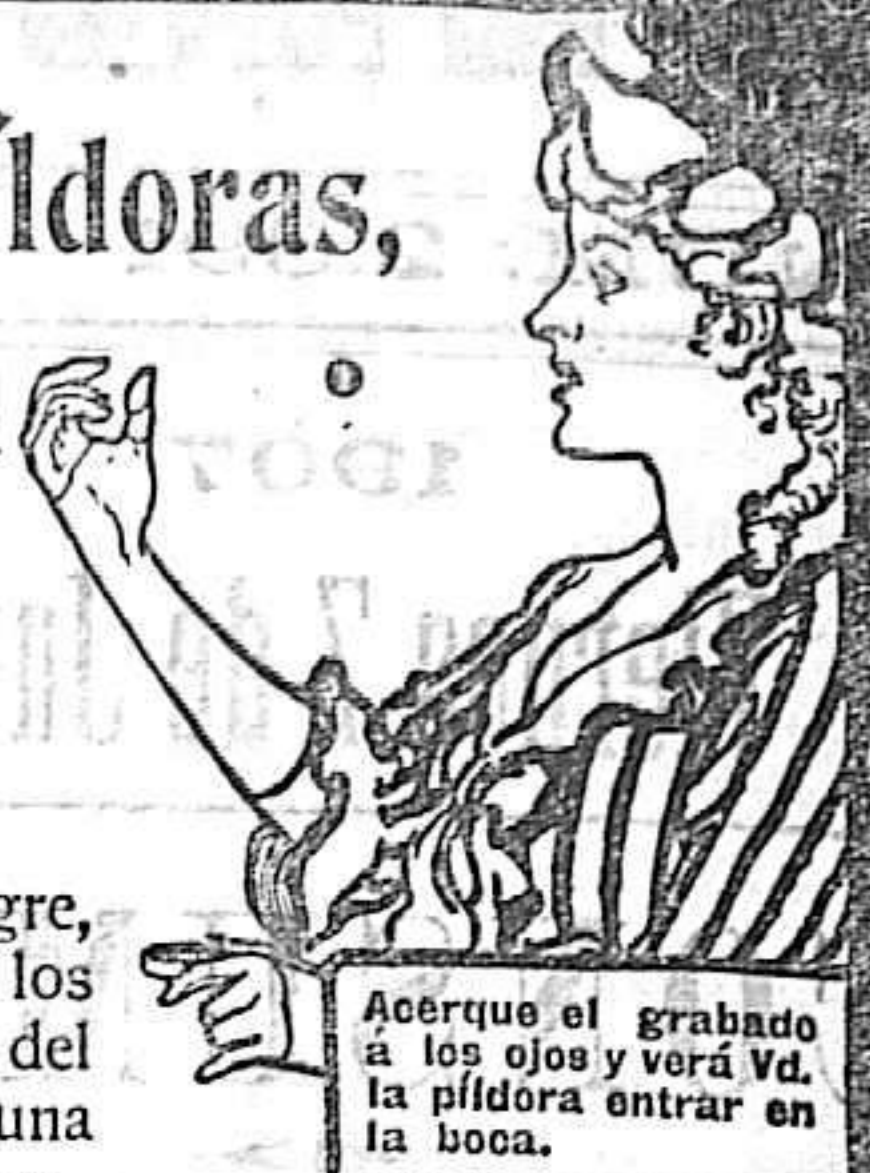
Acerque el grabado á los ojos y verá la píldora entrar en la boca.

DE VENTA EN LAS BOTICAS DEL MUNDO ENTERO, 40 Píldoras en Caja.