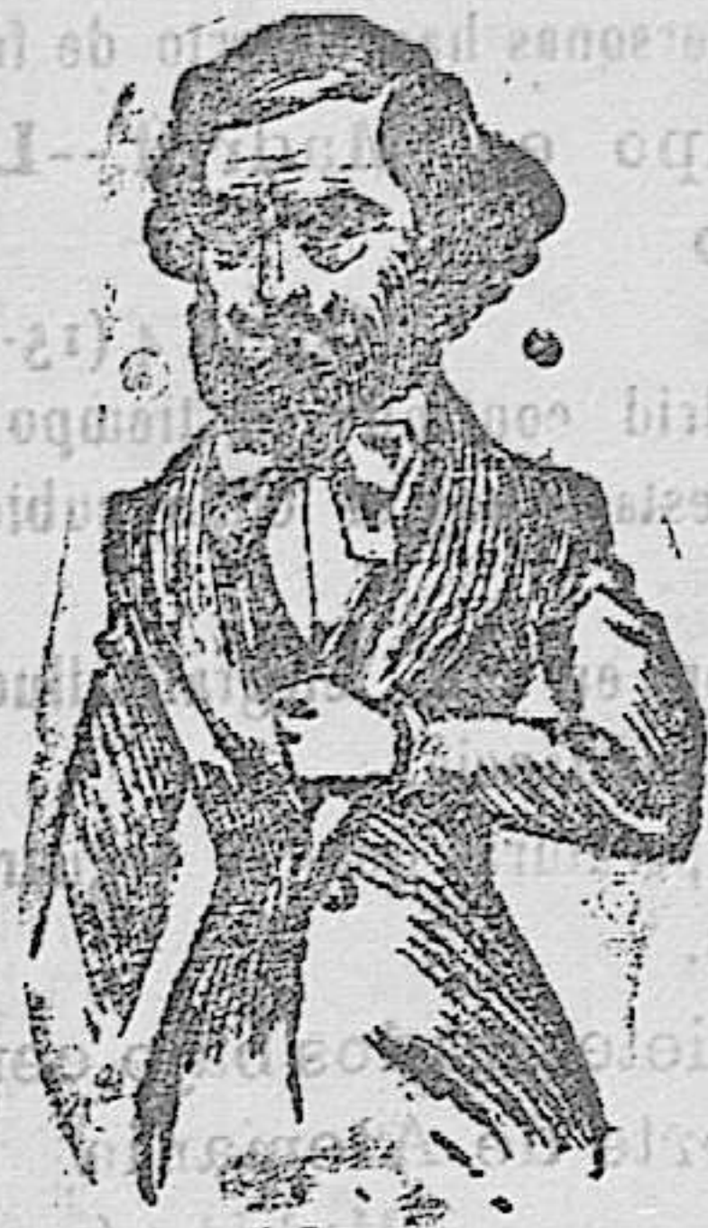
(De una caricatura de la época)

El origen de la claque hay que ir á buscarlo á París, punto donde lo mismo se fabrican entusiasmos que se destruyen reputaciones artísticas.