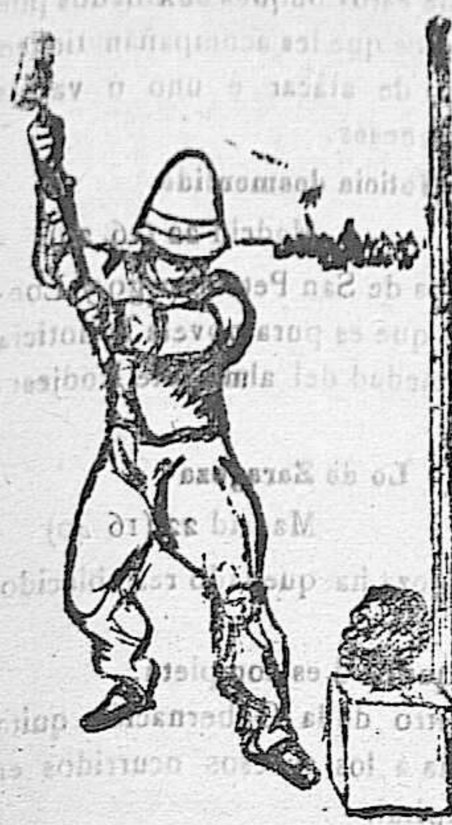
Los franceses en sus colonias

—¿Qué demonio! Esto es muy aburrido. En algo ha de pasar uno el tiempo.