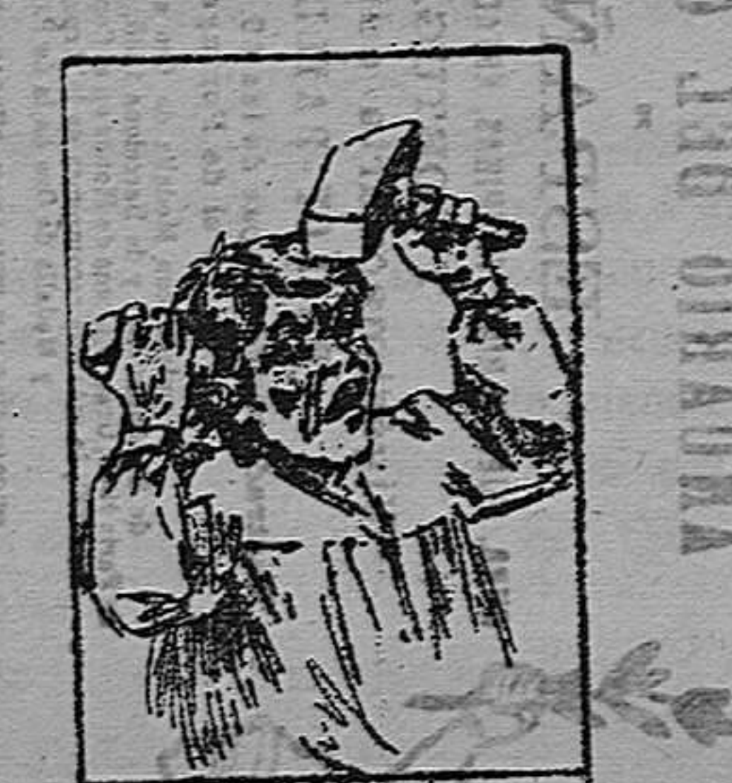
Imp. del HERALDO DE ALCOY

Ha sido proclamada la independencia del istmo de Panamá.