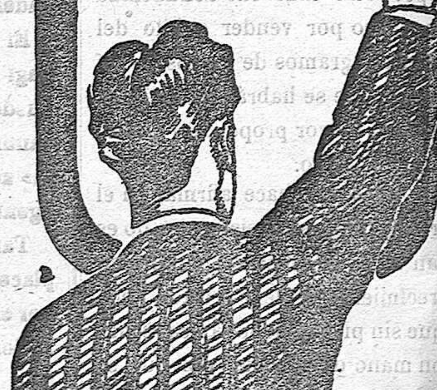
FRASE EN FARMACIAS Y ESCOPIAS

y los Médicos le llaman el REMEDIO DE LOS DÉBILES