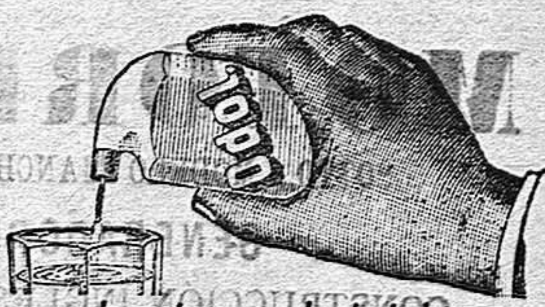
lo mejor para la dentadura el frasco Ptas 3.50

Unico punto de venta en Alcoy: Farmacia Moderna, de A. Segura.