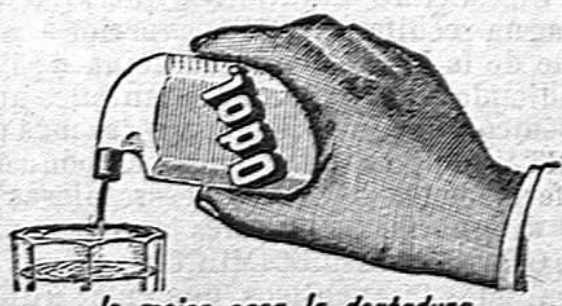
lo mejor para la dentadura el frasco Ptas 3-50

Único punto de venta en Alcoy: Farmacia Moderna, de A. Segura.