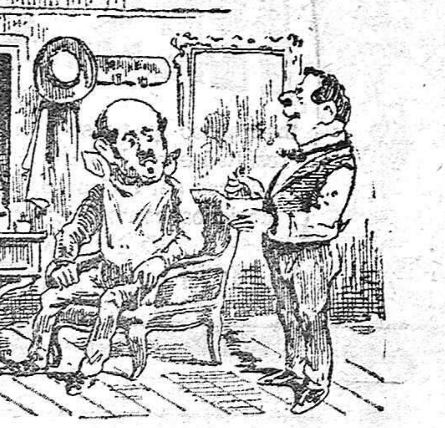
Fig. del HERALDO DE ALCOY