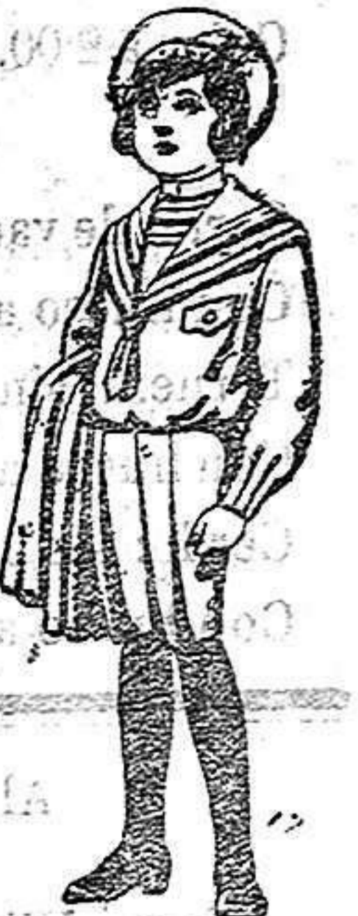
Trajes de jerga negra o azul pa-rra niños de 4 a 9 años. De 5 a 10 ptas