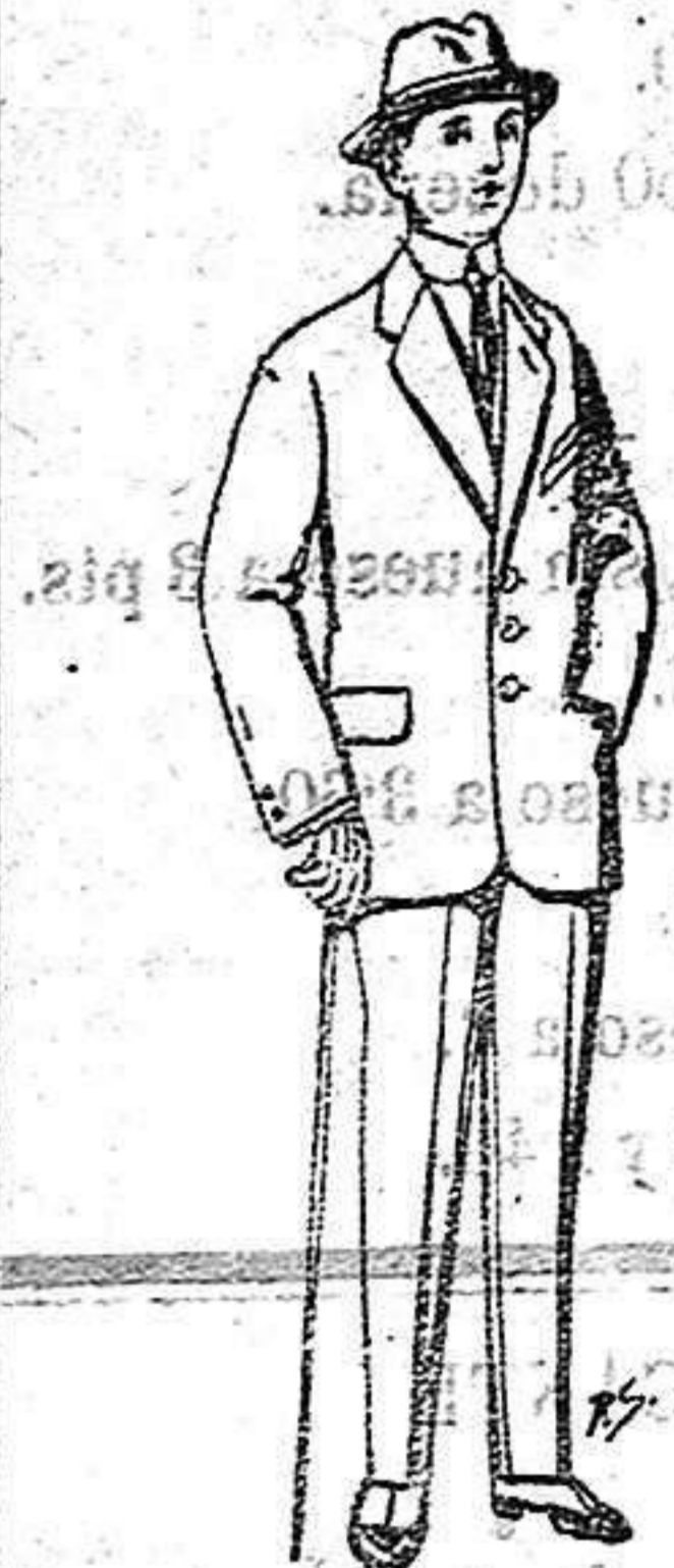
Trajes paten, vi-cuña o jerga pa-rra niños de 10 a 16 años. De 14 a 50 ptas