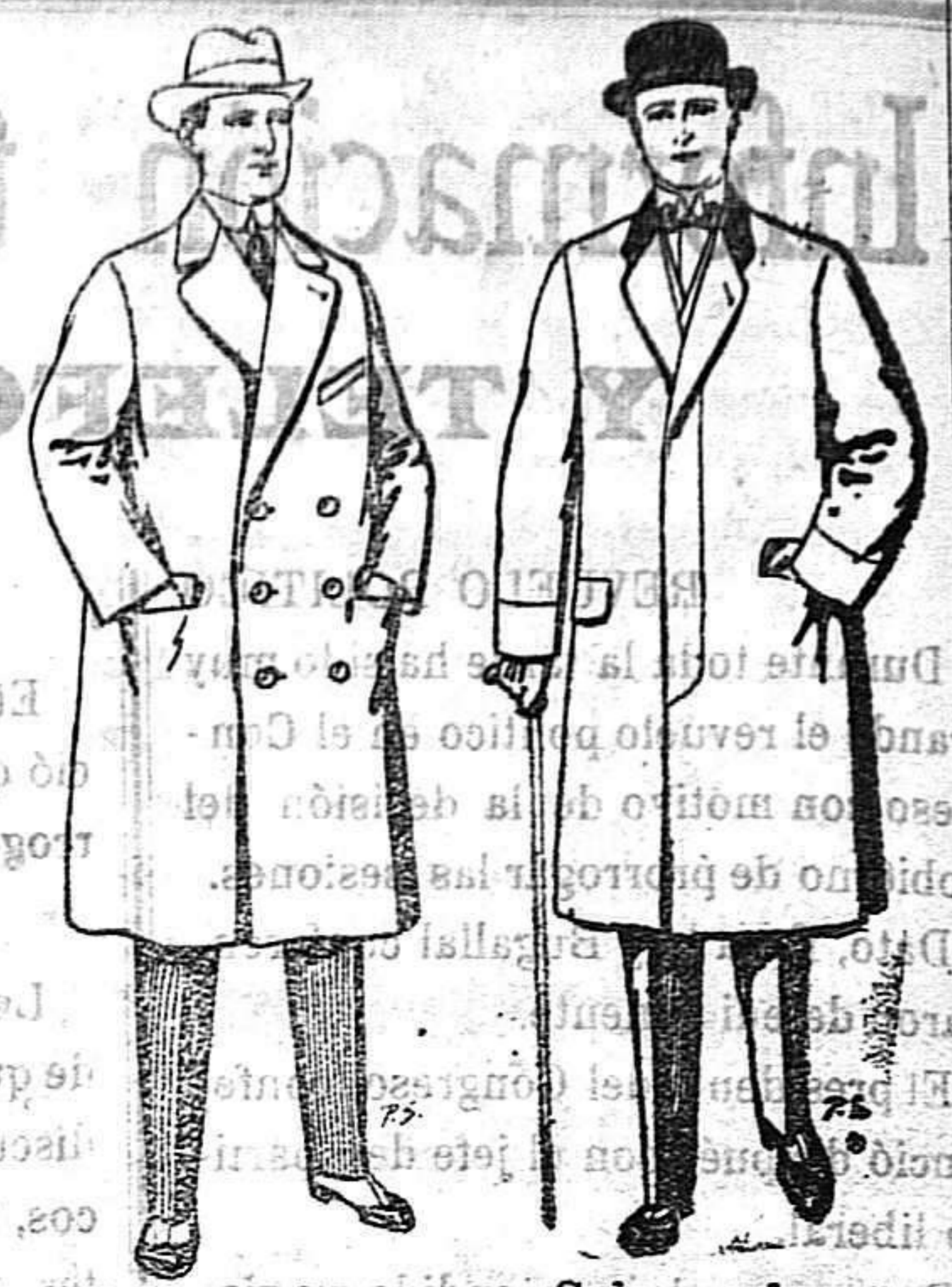
Gabanes de paten cheviot etc. De 55 a 105 ptas. Gabanes de paten melton o cheviot. De 25 a 100 ptas.