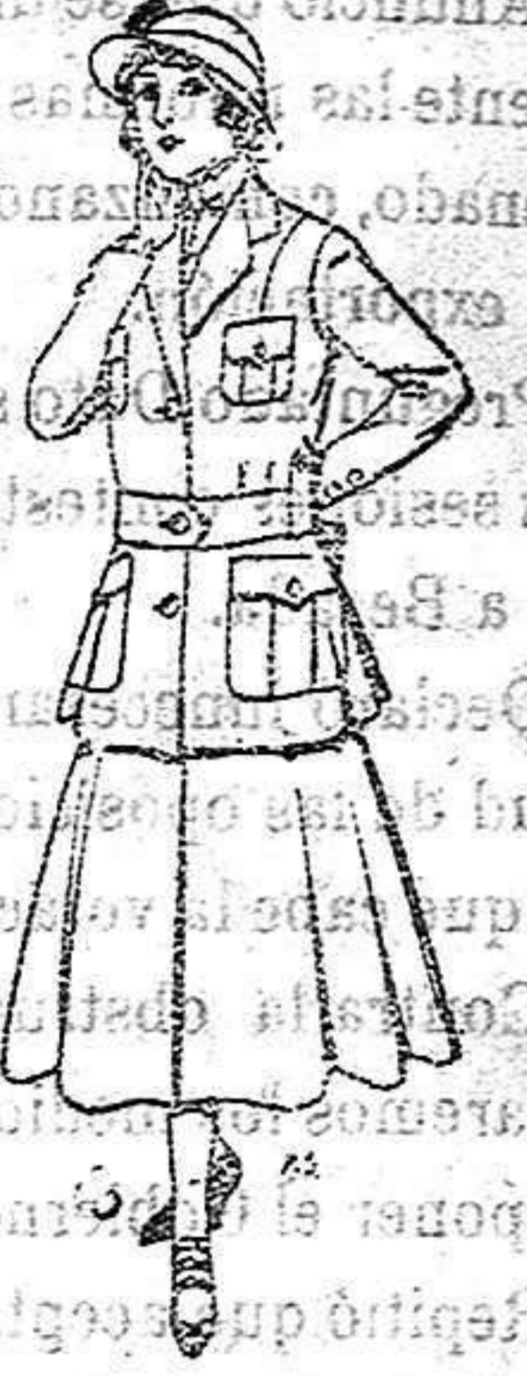
Trajes de lana para jovencitas de 13 a 16 años. De 40 a 45 ptas.