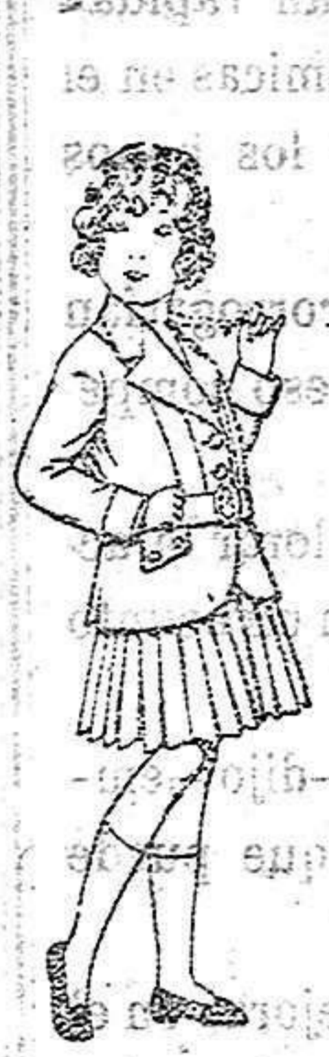
Trajes de lañilla para niñas de 4 a 11 años. De 20 a 35 ptas.