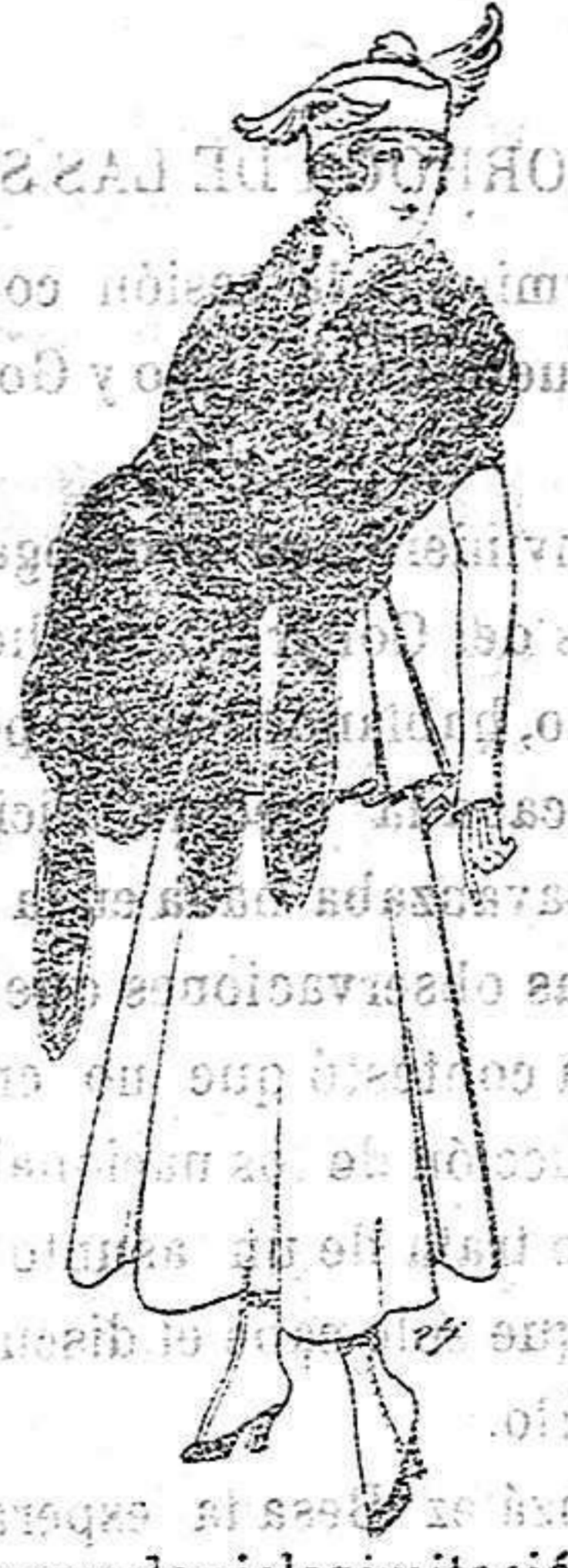
Juego de pieles imitación perfecta al renard negro. De 40 a 45 ptas