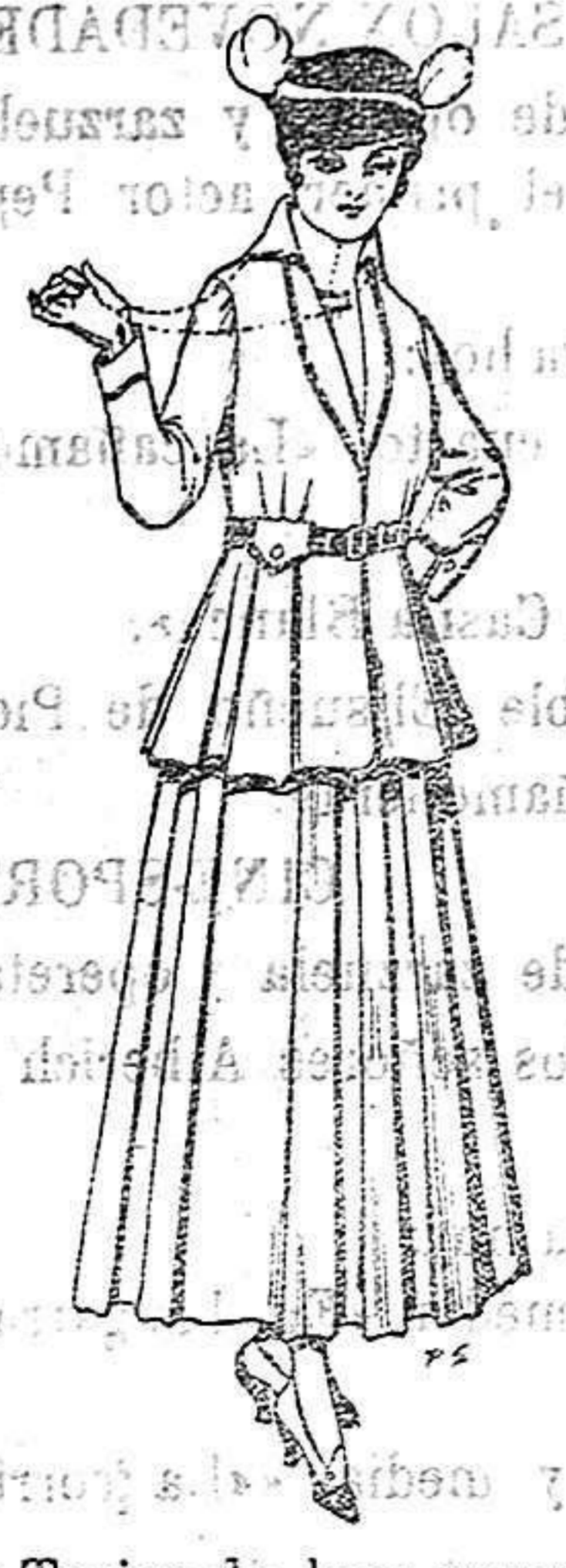
Trajes de lana negra, azul y color para señora. A 85 ptas.