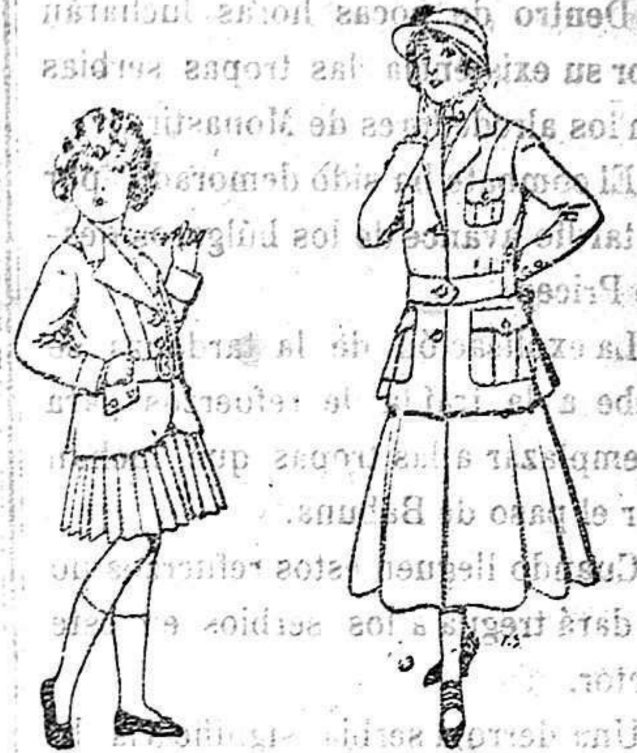
Trajes de lanilla para niñas de 4 a 11 años De 20 a 35 ptas. Trajes de lana para jovencitas de 13 a 16 años De 40 a 45 ptas.