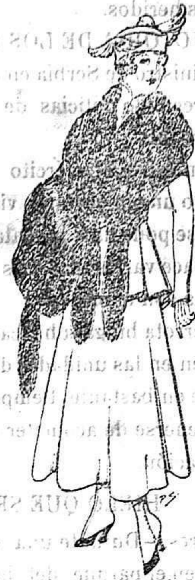
Juego de pieles imitación perfecta al renard negro De 40 a 45 ptas