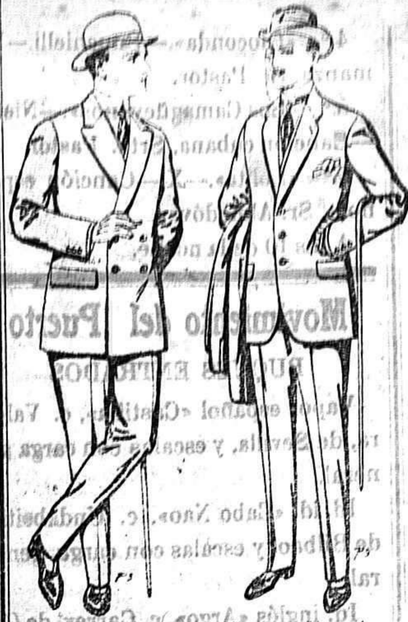
Trajes de cheviot paten etc. De 27 a 85 ptas. Trajes de paten cheviot etc. De 17:50 a 80 ptas