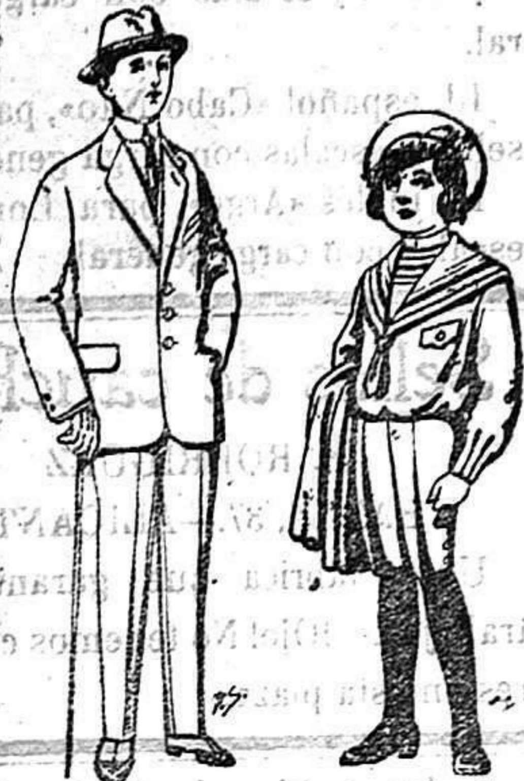
Trajes paten, vi-cuña o jerga para niños de 10 a 16 años De 14 a 50 ptas Trajes de jerga negra o azul para niños de 4 a 9 años De 5 a 10 ptas