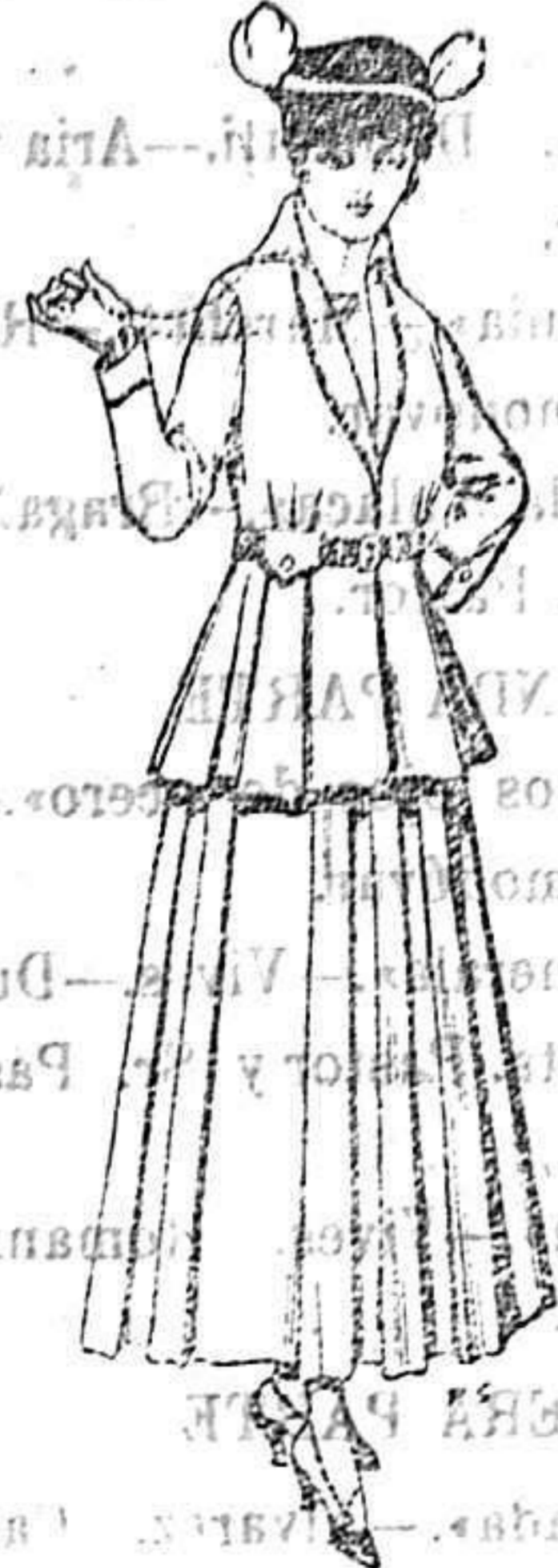
Trajes de lana negra, azul y color para señora A 85 ptas.