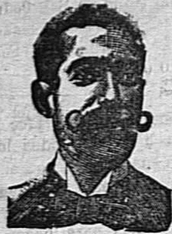
A. SALVATI COSTANZI Calle Diputación, 435.-Barcelona