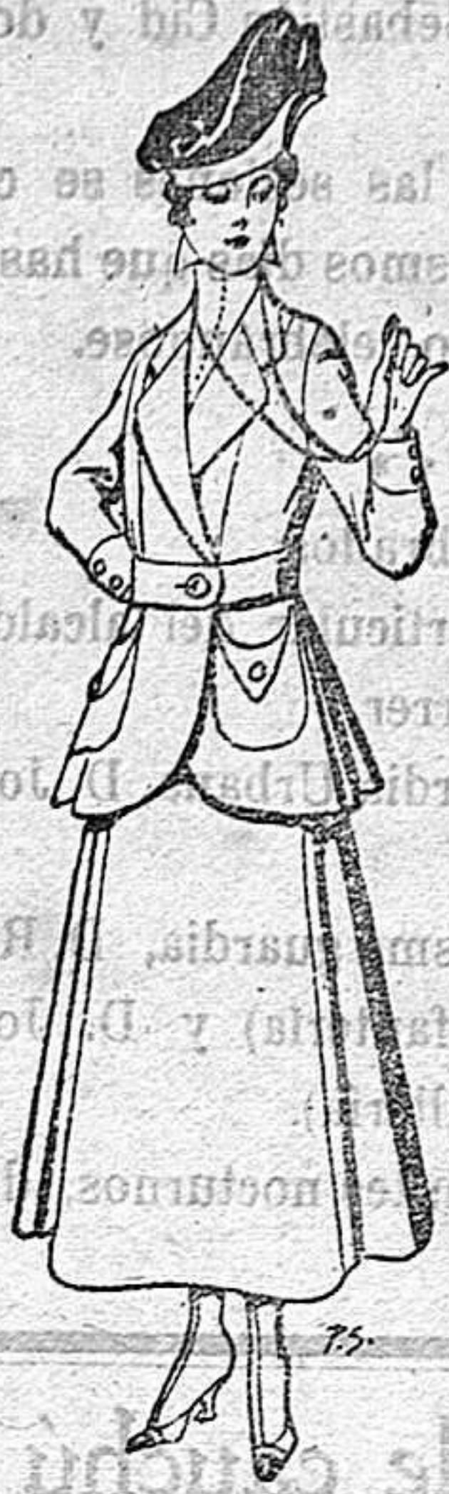
Trajes de lana negra, azul y color para señora De 50 a 55 ptas