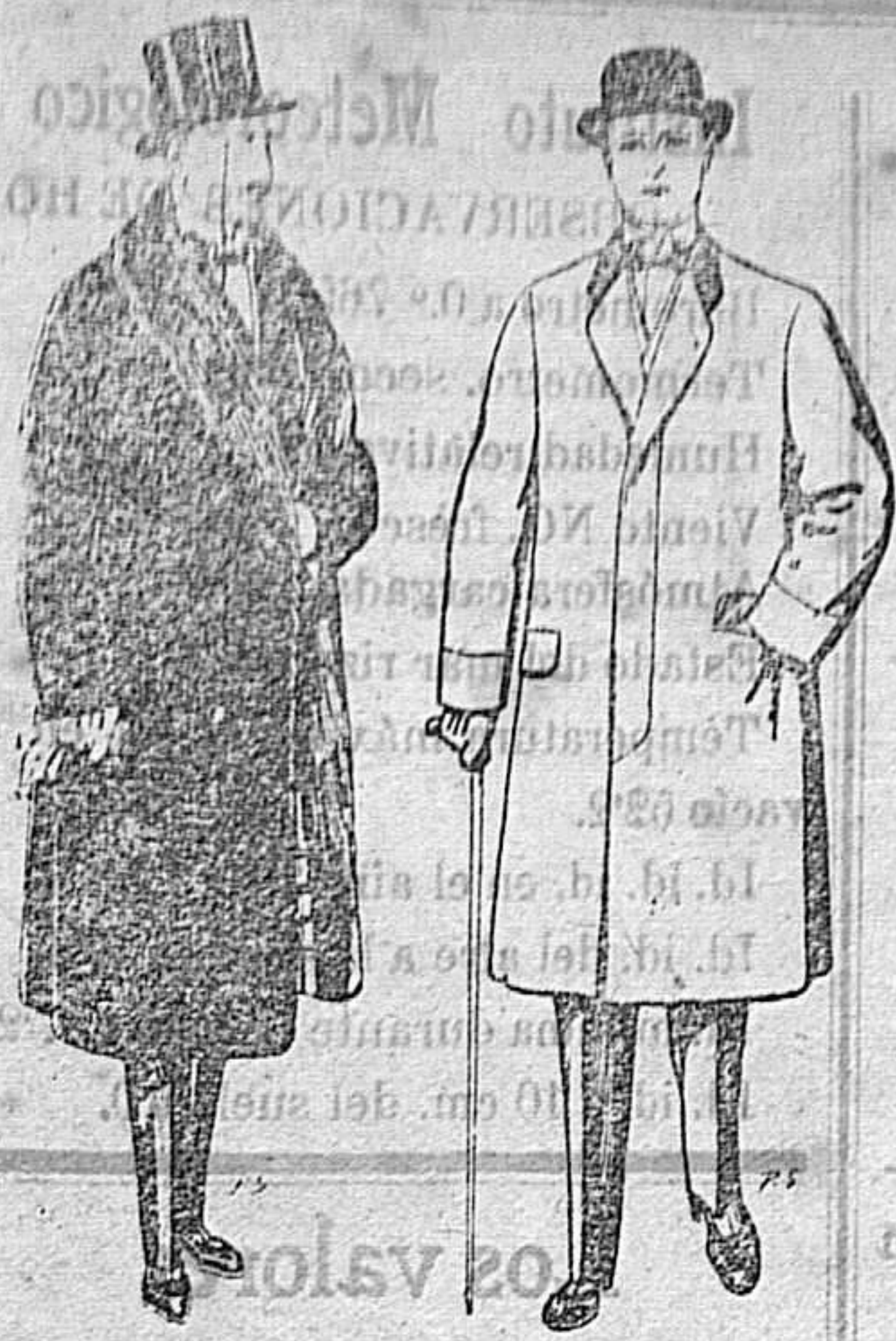
Gabanes de edredón negro forro seda cuello y vistas de piel A 125 y 135 ptas. Gabanes de paten melton o cheviot De 25 a 100 ptas.

Peletería, Camisería, Géneros de Punto, Corbatería, Guantería, Sombrerería, Zapatería, Paraguas, Bastones y Artículos de Viaje.