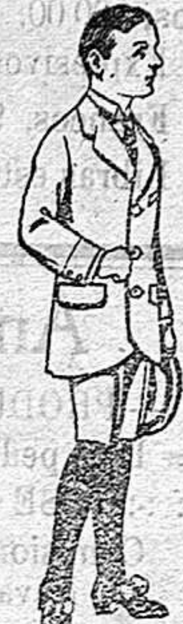
Trajes de paten para niños de 7 a 12 años De 16 a 40 ptas