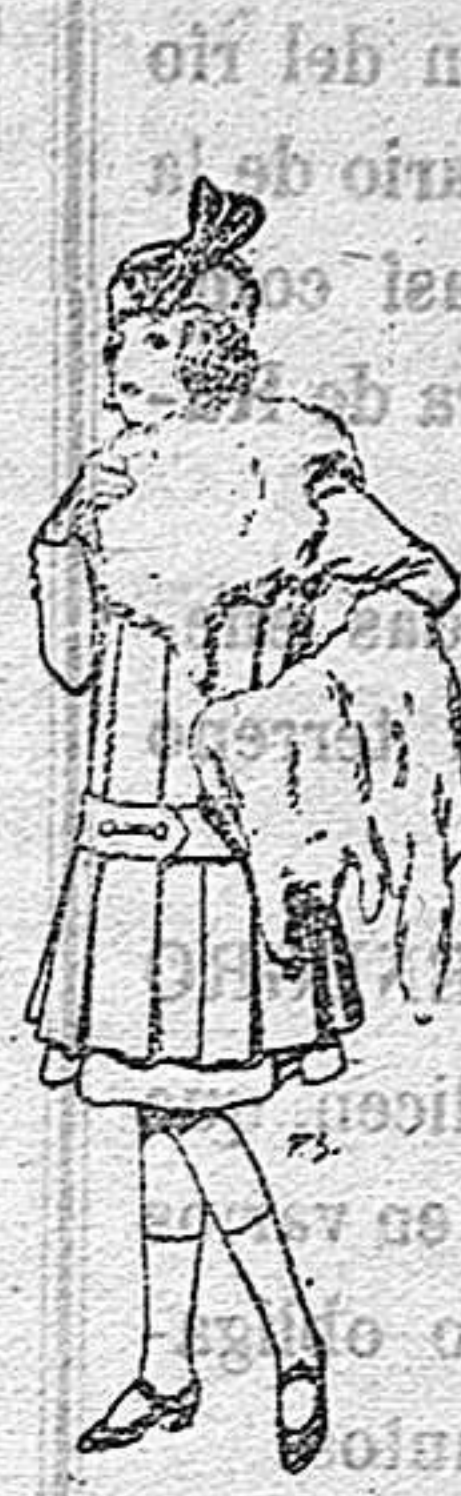
Juego de pieles para niñas A 15 ptas.