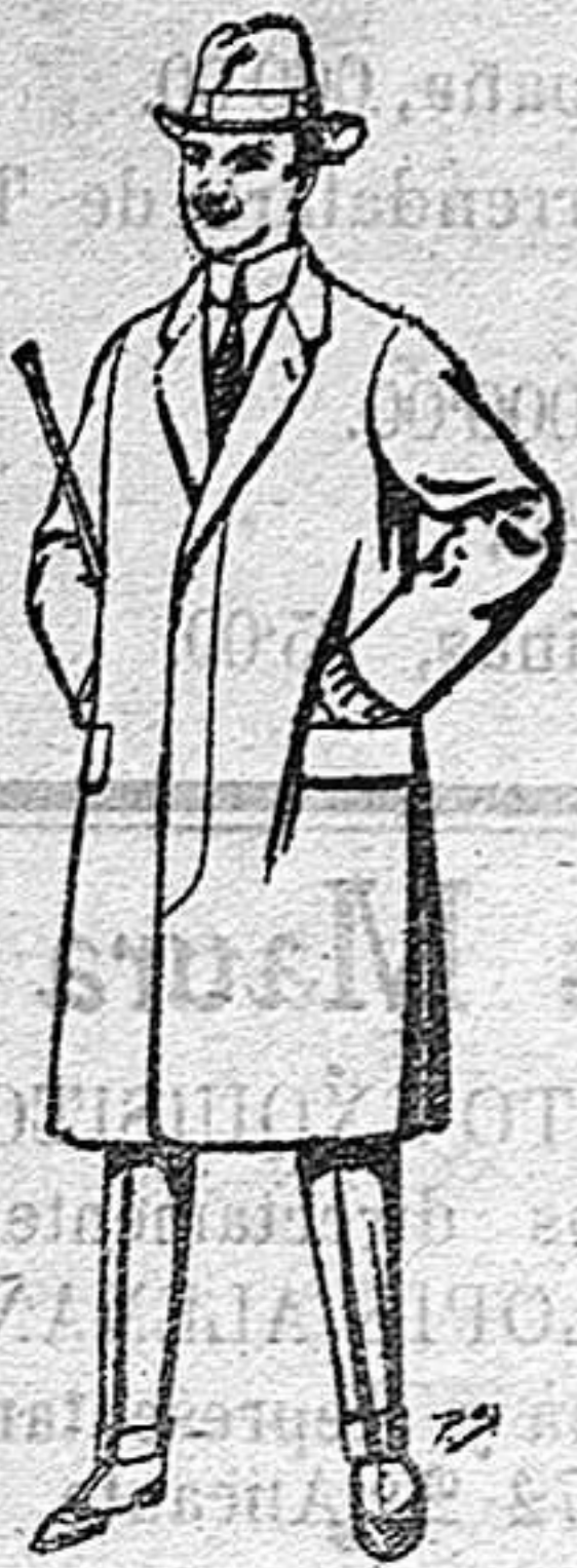
Gabanes de lana vigonia o melton para niños de 10 a 16 años De 20 a 36 ptas.