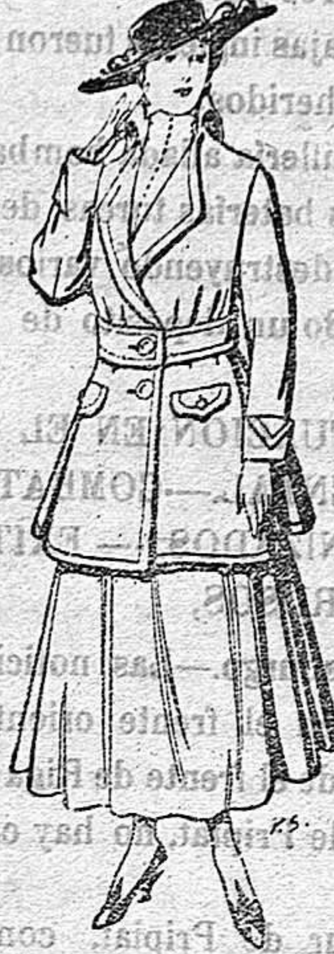
Abrigos de patén gran novedad para señora De 26 a 40 ptas.