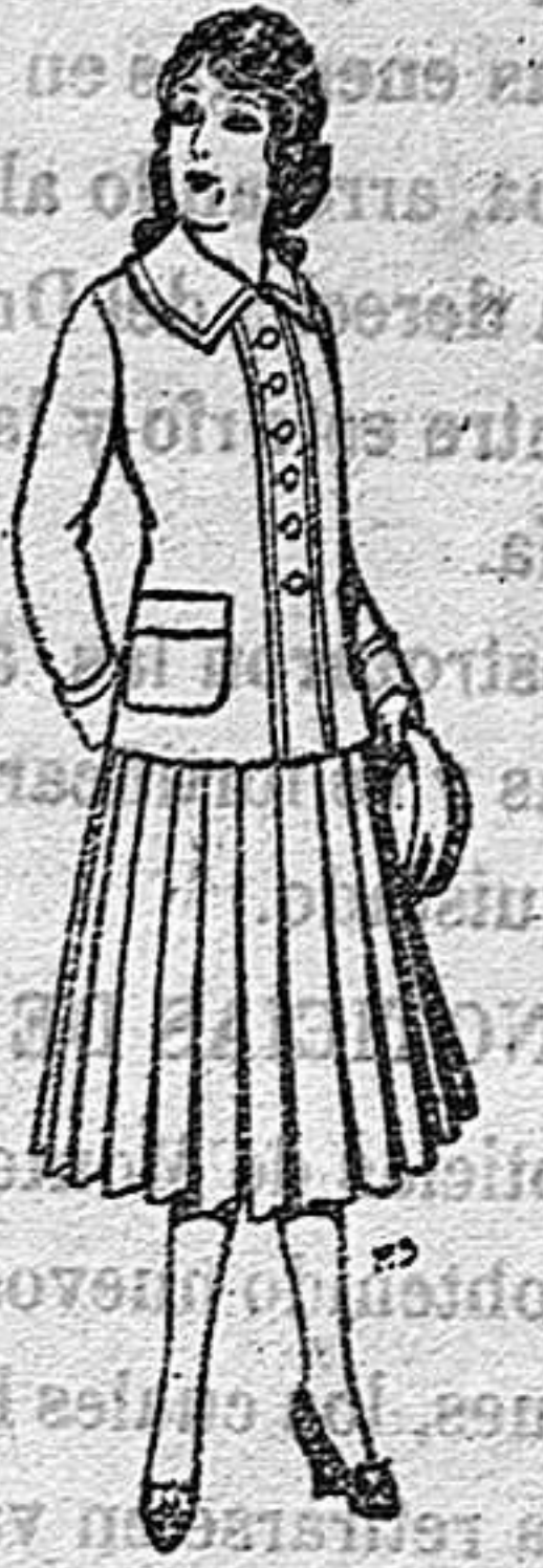
Paletor de lana para jovencitas de 13 a 16 años De 12'50 a 20 ptas.