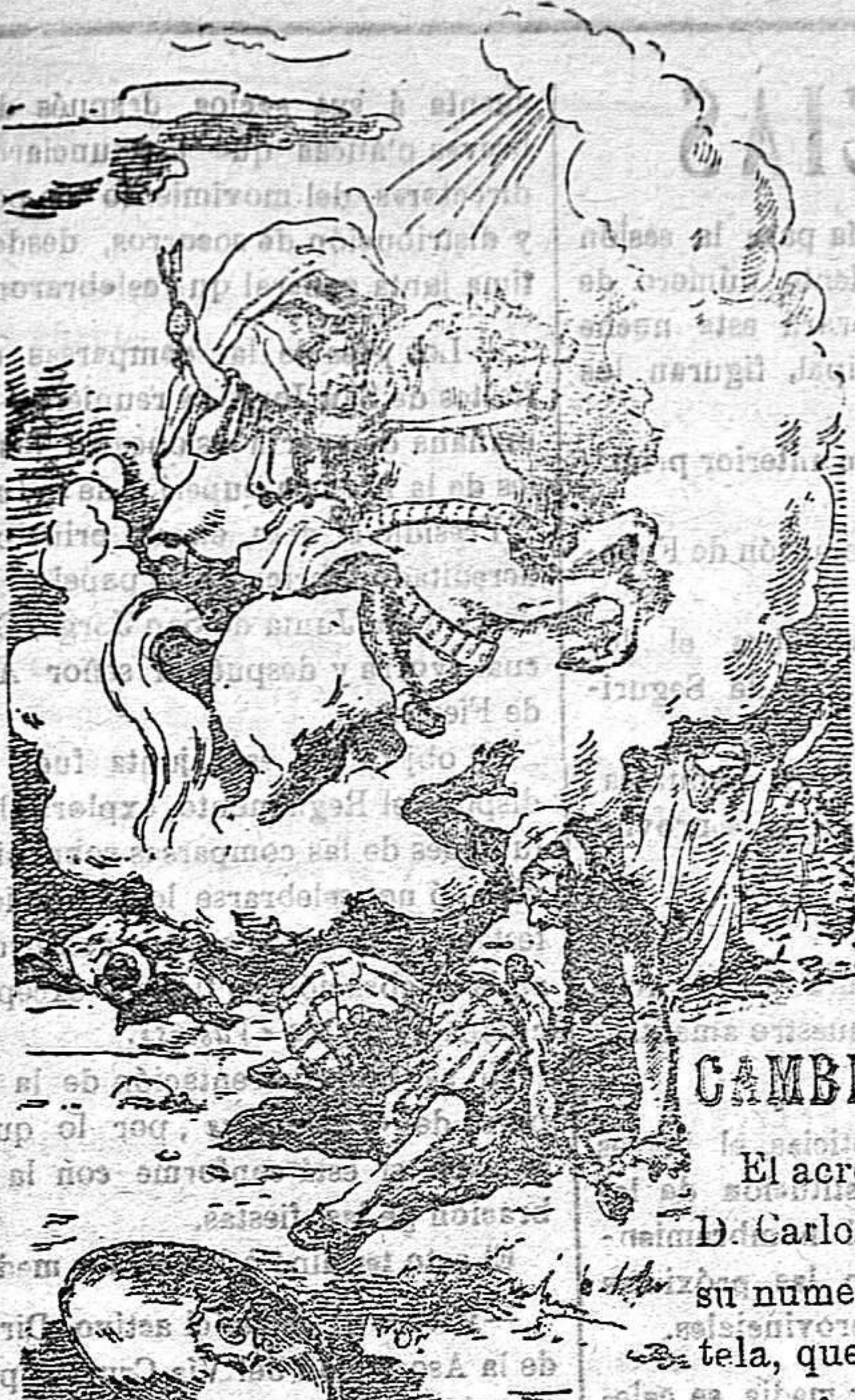
¡Juicio Mártir San Jorge! Defiende al pueblo de Dios

Precios de suscripción Alcoy al mes . . . . . 1'50 Ptas. Para los obreros al mes . . . . . 0'75 Ptas. Fuera al trimestre . . . . . 4'50 Ptas. Número atrasado . . . . . 0'15 Ptas.