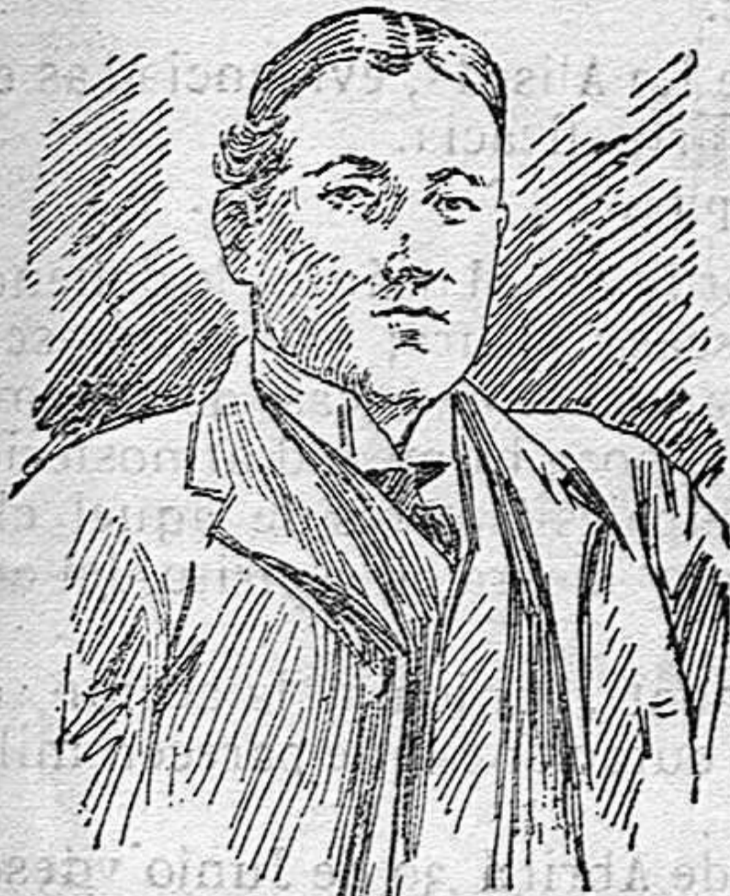
Mr. E. Shackleton, jefe de la expedición.