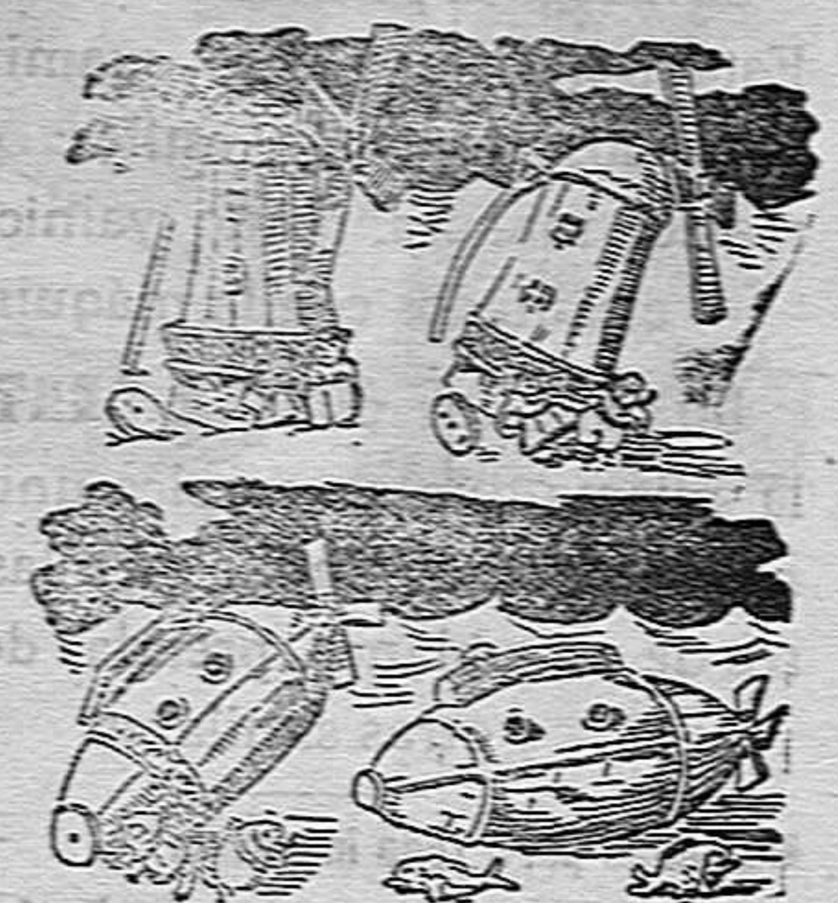
La evolución del submarino Holland.