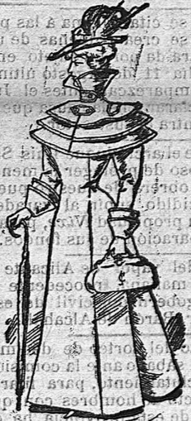
Aarigo largo para paseo

De pañete azul marino. Cuerpo ajustado, adornado el delantero con terciopelo y «soutache»; cuello alto con rizado de gasa y fada acampanada, adornada también con «soutache»; completan este bonito vestido.