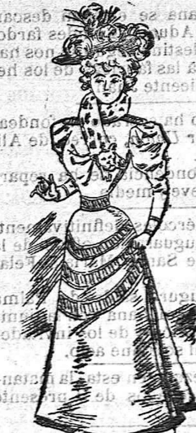
Traje para entretiempo

De cheviot y delanteros rectos abrochados al lado con tapeta; espalda acampanada y esclavina de tres valonas con pespunte. Cuello abrochado por una pata y botones iguales a los de la esclavina y mangas al biés con cartera doble.