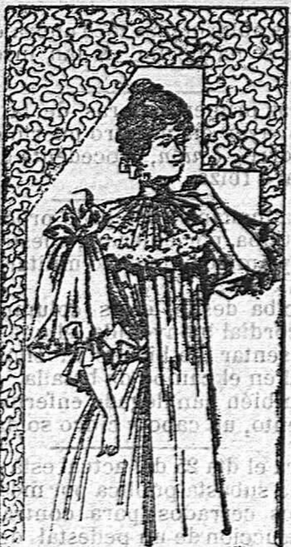
Bata para verano

De crespón verde Nilo. Blusa de muselina marfil plegada; lazos de raso rosa té y cuello de encajes.