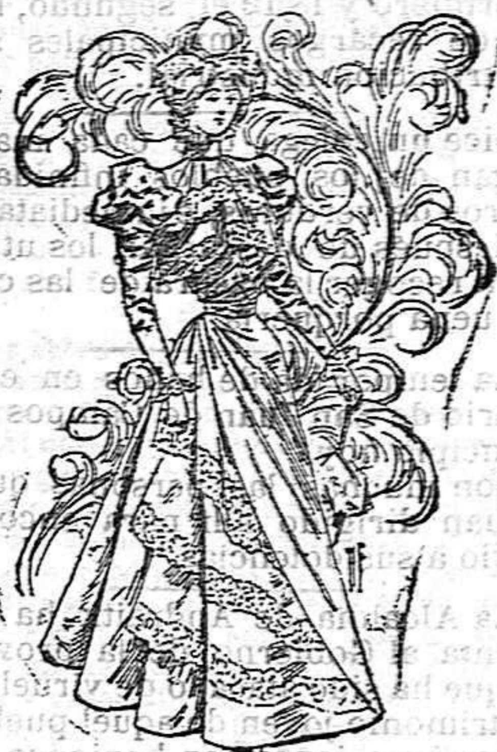
Traje para carreras

De seda, fondo blanco salpicado de flores rosa. Cuello entallado con dos volantes de tul, bordado en el borde. Cuello alto de terciopelo rosa; mangas estrechas con un pequeño bollo recogido y falda en tres volantes y ancaje en el borde.