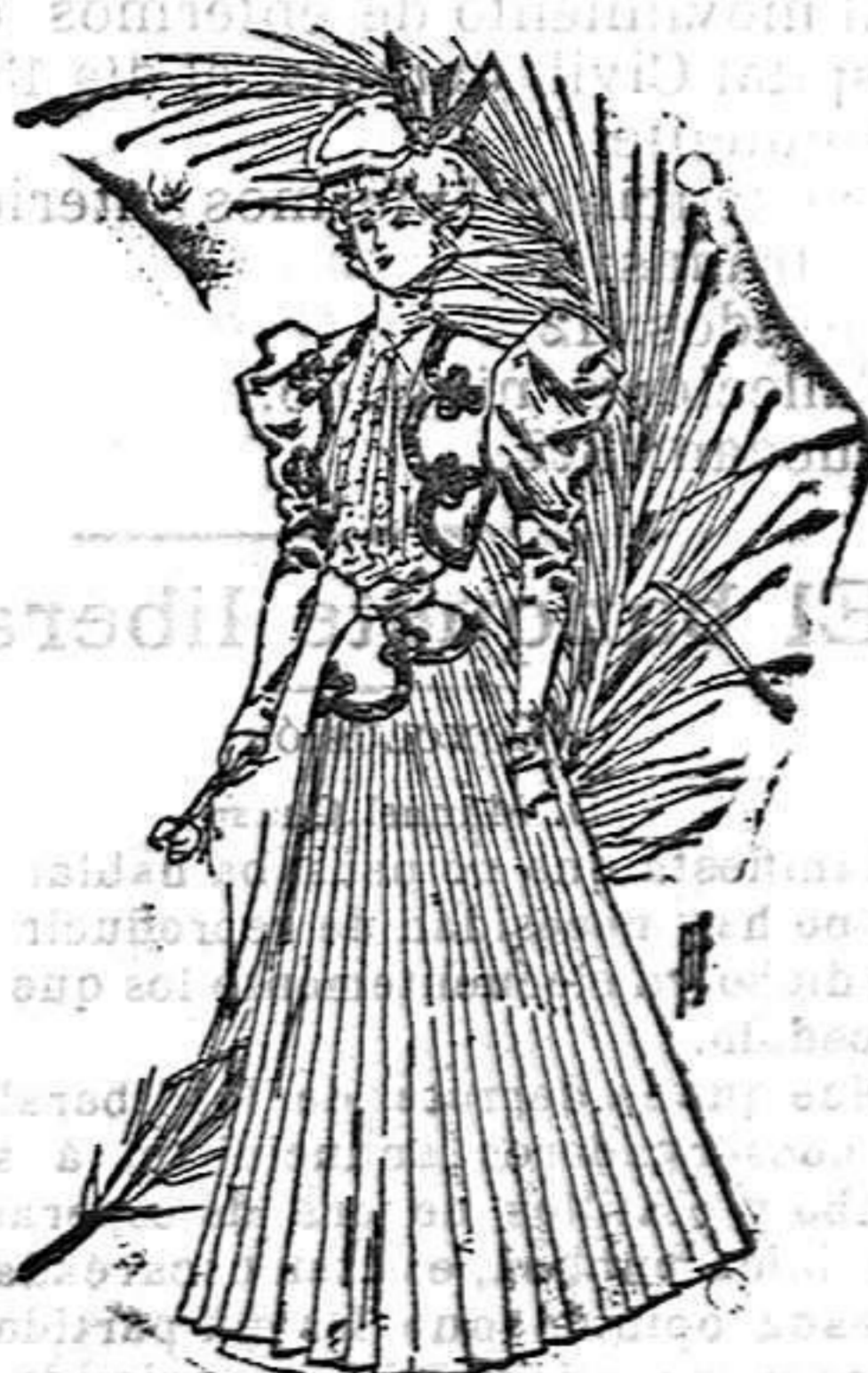
Traje para campo

De lana azul eléctrico. Cuerpo de tul bordado, flojo en el talle; torera de lana, adornada con rulos de gasé; cuello alto y corbata con dos vueltas; cinturón de gasé y falda acordeón montada sobre otra lisa, adornada con rulos.