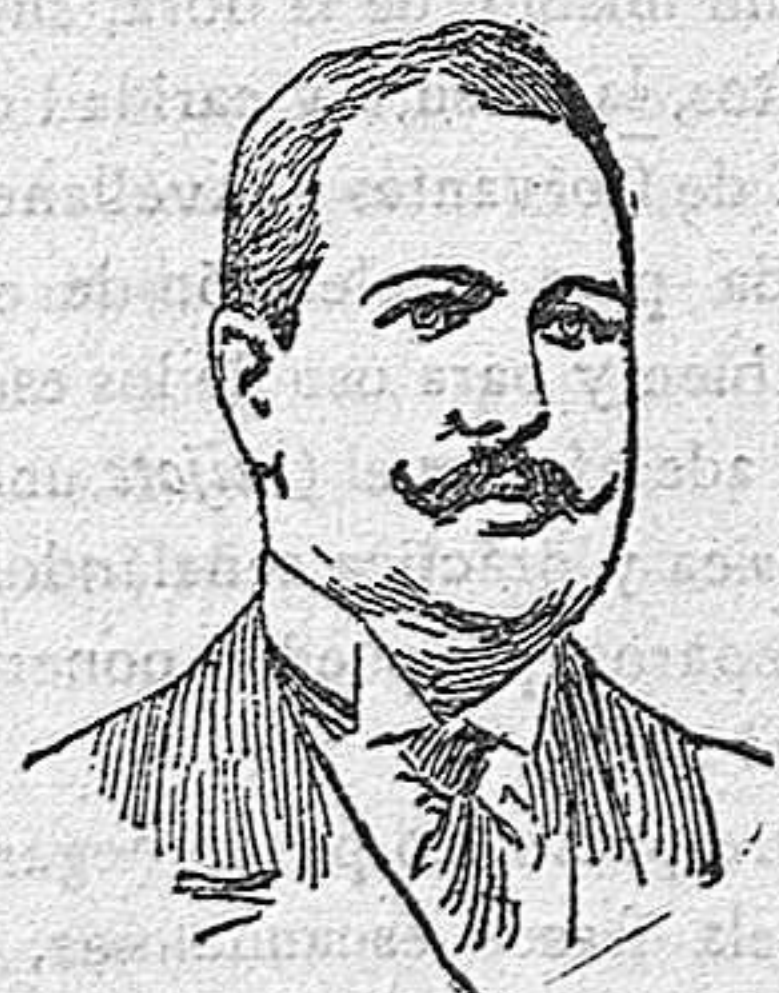
Subsecretario de la Presidencia.

Hijo del difunto Duque de la Torre, viene afiliado á la política del partido liberal hace varios años.