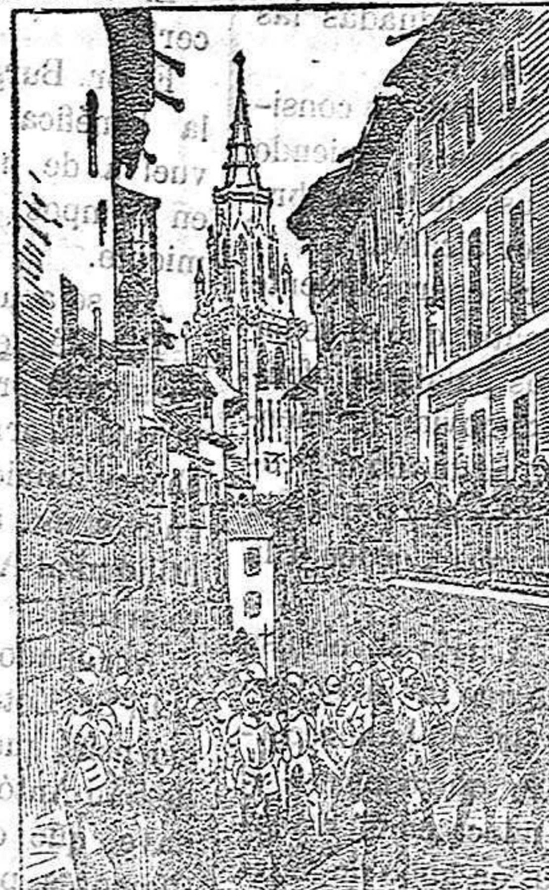
Paso de la procesión del Viernes Santo por la calle del Hombre de Palo

modernas; la Ley de amor promulgada por Cristo, se conserva lozana á través de veinte siglos, vive incorrupta, porque están sus páginas empapadas en la incorruptible sangre del Hombre-Dios. Hoy en todas las naciones cristianas se celebra una sublime ceremonia, recuerdo de la del Calvario; á los pies de Cristo crucificado y en nombre del que murió perdonando, el jefe del Estado perdona, restituye el derecho á la vida á unos cuantos reos de pena capital. Hermosa prerrogativa, digna de la regia magnanimidad cuando es suave fruto del árbol de la compasión, cuando se coloca sobre la cabeza de quien en el vértigo del crimen apenas supo lo que se hizo; que las torcidas miras humanas no la conviertan jamás en vergonzosa repetición de la escena del Pretorio; la turba desenfrenada arrancando con amenazas á un Juez débil la libertad de Barrabás!