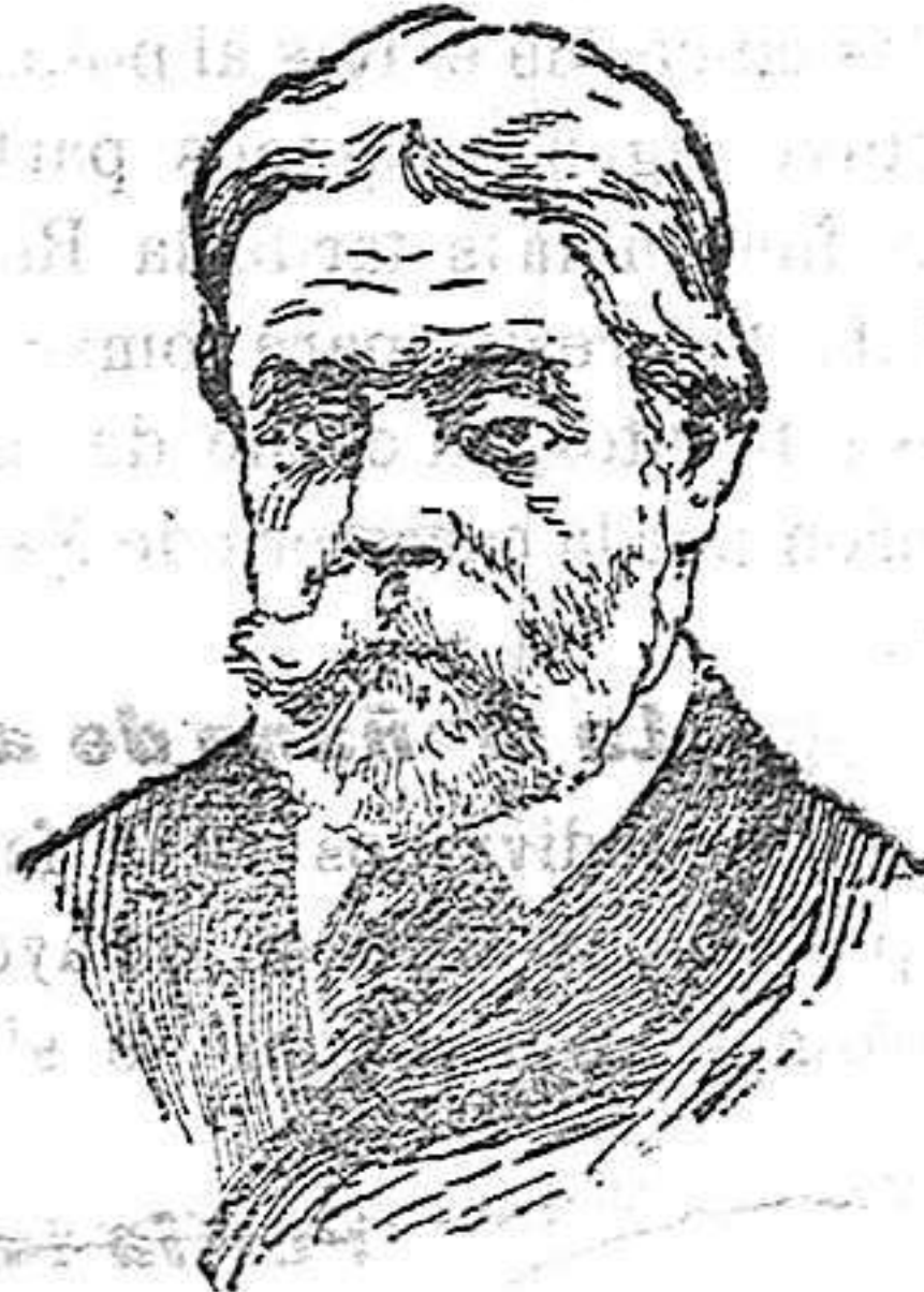
Ilustre pintor inglés, genial intérprete de costumbres pompeyanas, que acaba de fallecer en Wiesbaden.