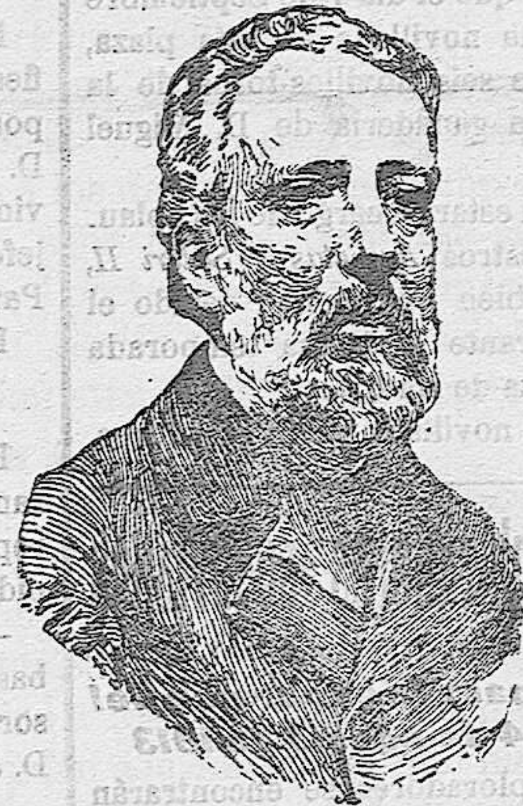
Sol y Ortega, fallecido en Barcelona

Plan de estudios En el Diario Oficial aparecen aprobados los programas propuestos de materias para el desarrollo y adaptación de los planes de estudios para las distintas Academias militares; cuyos programas empezarán á regir desde el próximo curso de 1913 á 1914.