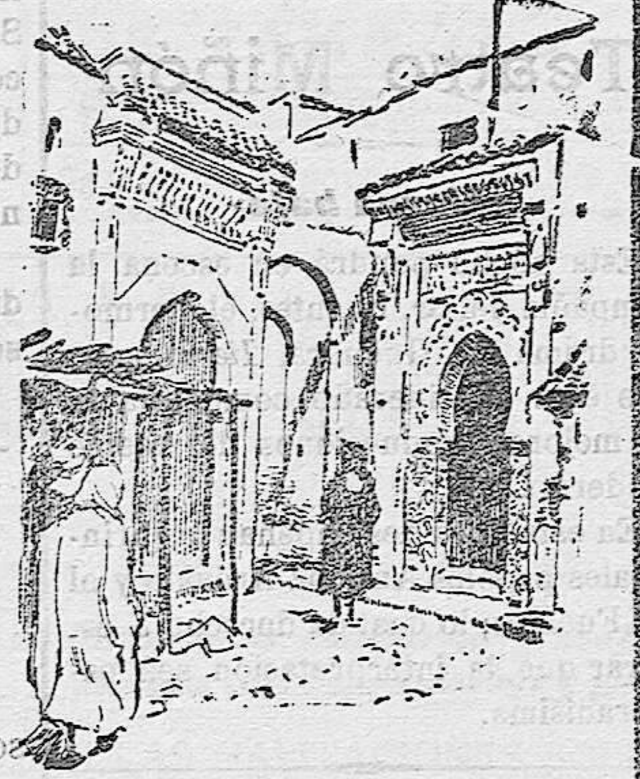
Mezquita de Sidi el Hach Ali el Baraca