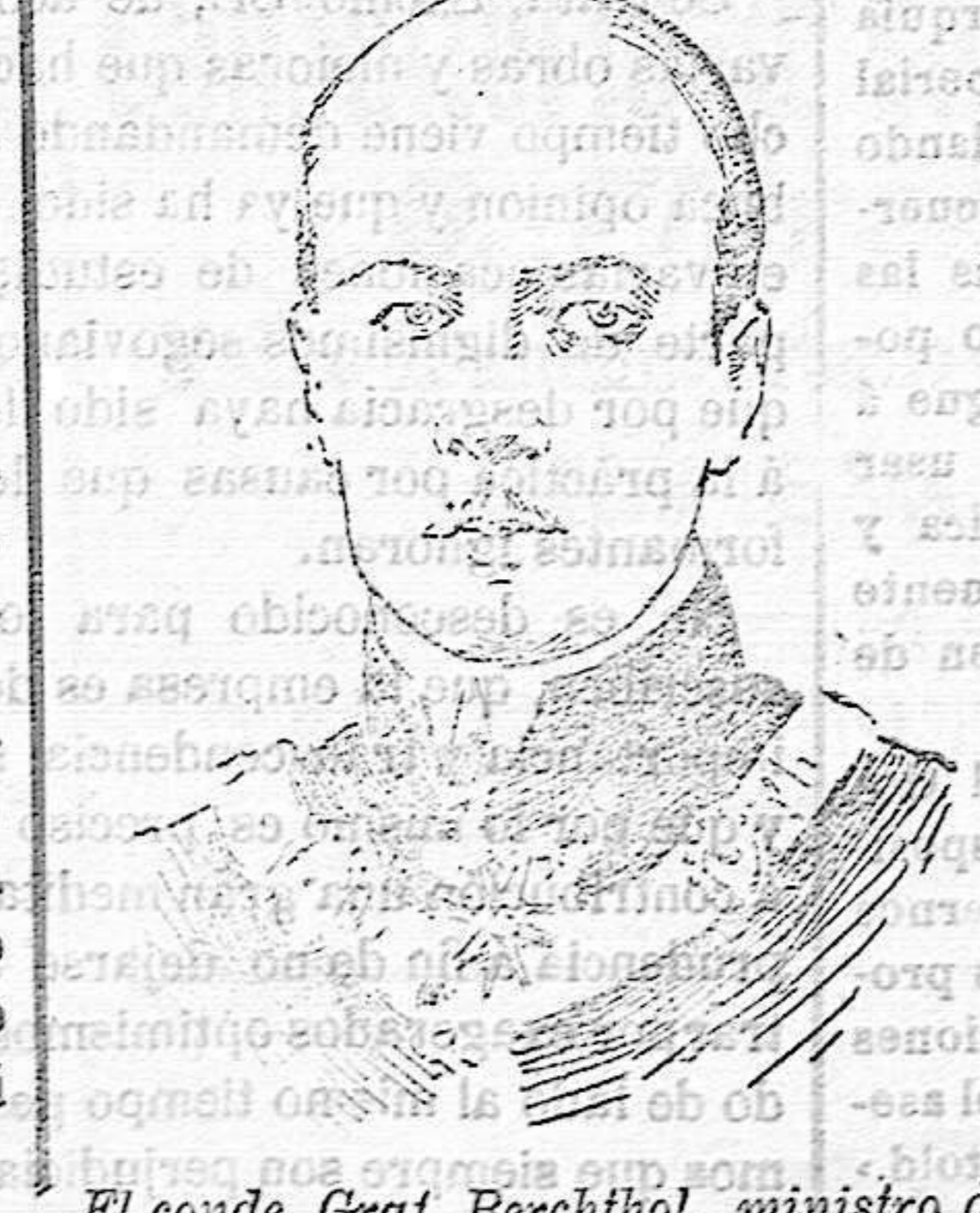
El conde Graf Berchtold, ministro de Estado de Austria, autor de la nota ultimatum que ha provocado la guerra austro-servia.