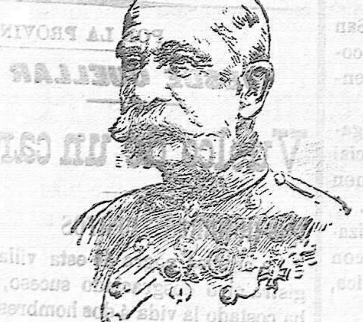
EL EMPERADOR DE AUSTRIA FRANCISCO JOSE

Acaso cuando estas líneas se publiquen, haya transcurrido el período de tiempo que los pesimistas creen ha de mediar de la ruptura de las relaciones diplomáticas entre Austria-Hungría y Servia y la declaración de guerra. No nos gusta presumir de profetas; pero apostaríamos doble contra sencillo á que esa declaración no ha de llegar á ser pronunciada y que el actual conflicto, después de haber llevado la alarma á todos los pueblos de Europa, de haber hecho gastar á una parte de ellos no despreciable número de millones en movilizar miles y miles de soldados y de haber producido en los mercados bursátiles quebrantos de que seguramente no lograrán resarcirse, será resuelto pacíficamente por las cancellerías, con la mediación de conciliadores amigos.