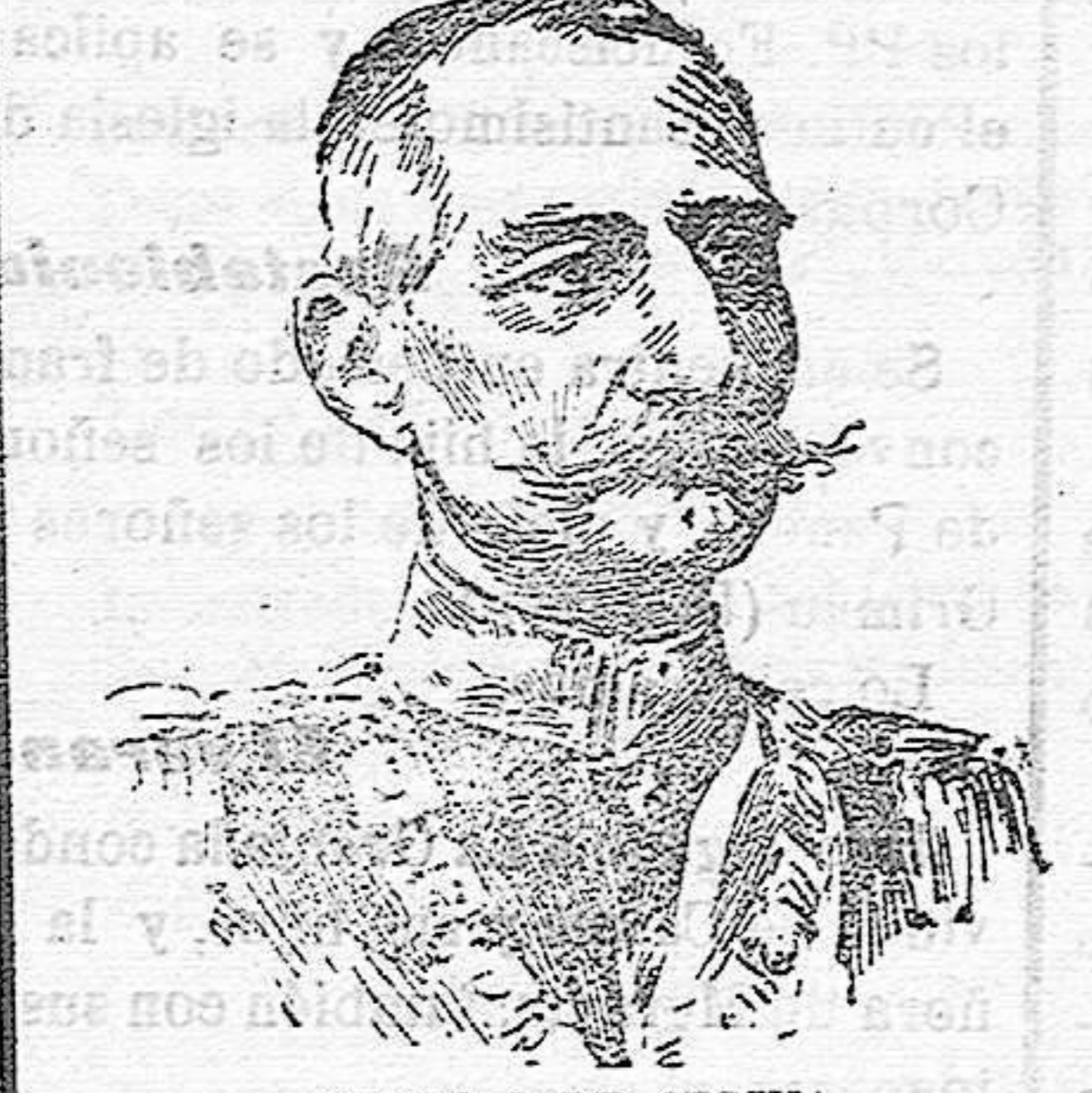
PEDRO I DE SERVIA

Pero hay otras razones muy estimables, aunque no de tanto peso como el temor á las consecuencias de la lucha, para no creer en la declaración de guerra.