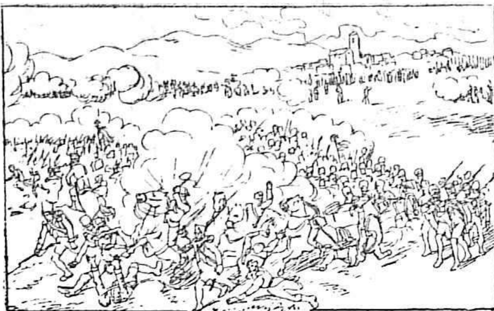
19 de Julio de 1809 Batalla de Bailén

Cercado por Reding y por Castaños, el general Dupont dividió sus tropas en dos columnas que movió el 18 por la noche, saliendo de Andújar para Bailén con la esperanza de derrotar á Reding, á quien atacó en la mañana del 19.