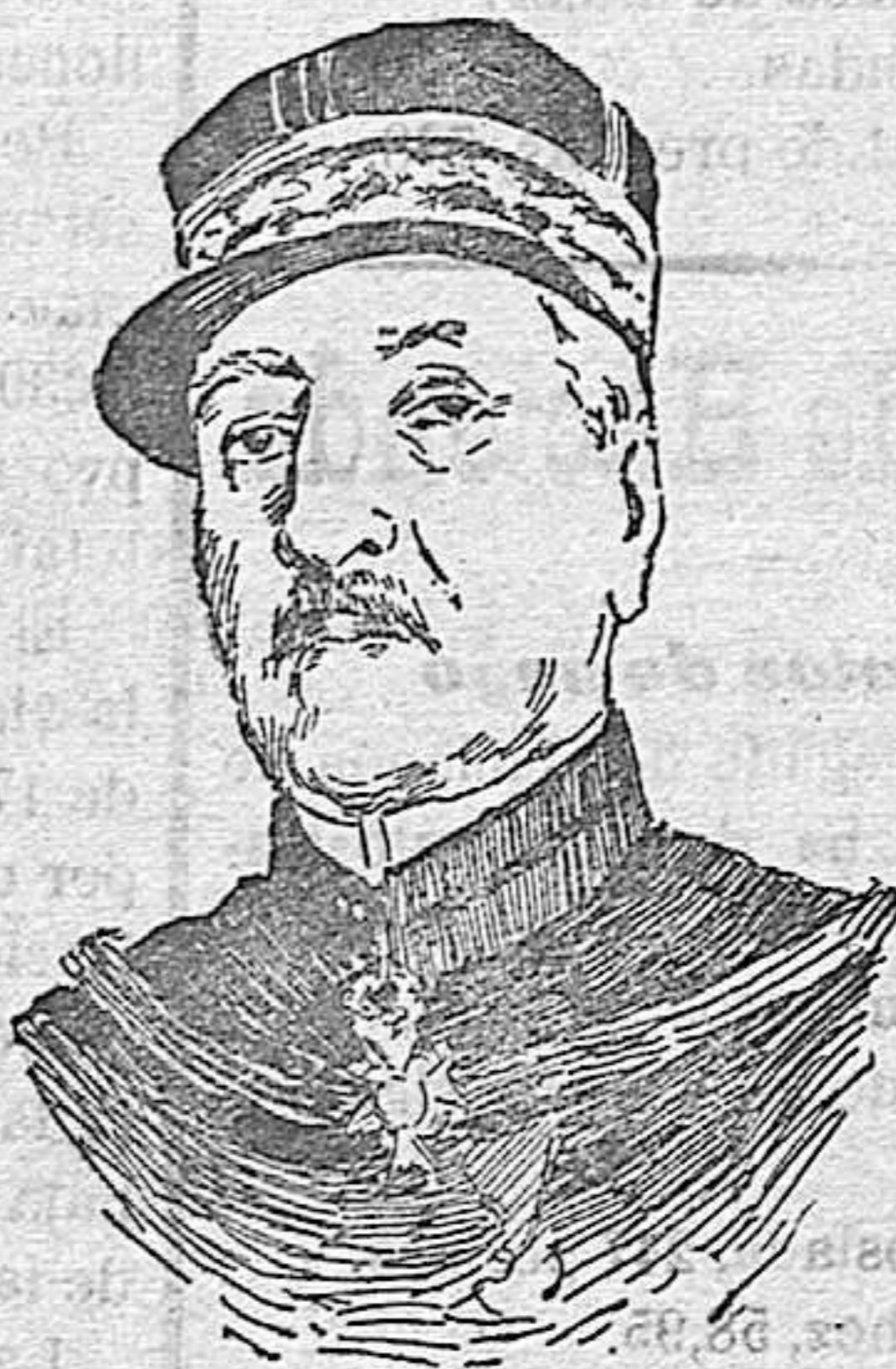
El general Castelnuovo, que ha sido nombrado segundo del general Joffre, ó jefe del Estado Mayor de éste.