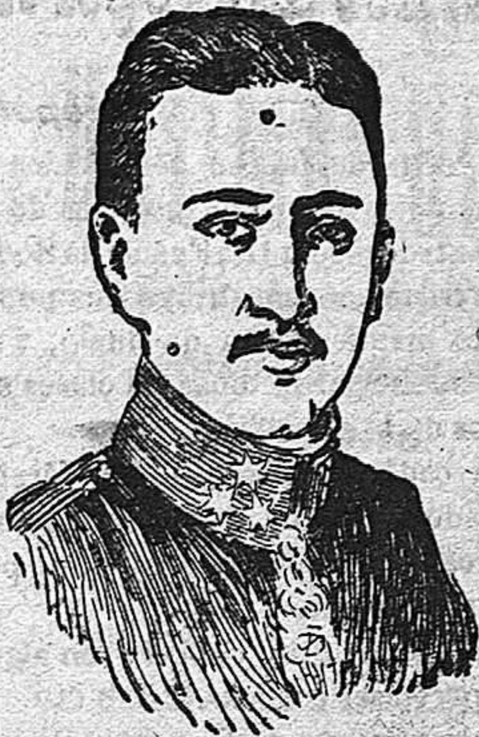
El archiduque heredero de Austria Carlos Francisco José, bajo cuya dirección se está desarrollando la gran ofensiva en el frente austro italiano.