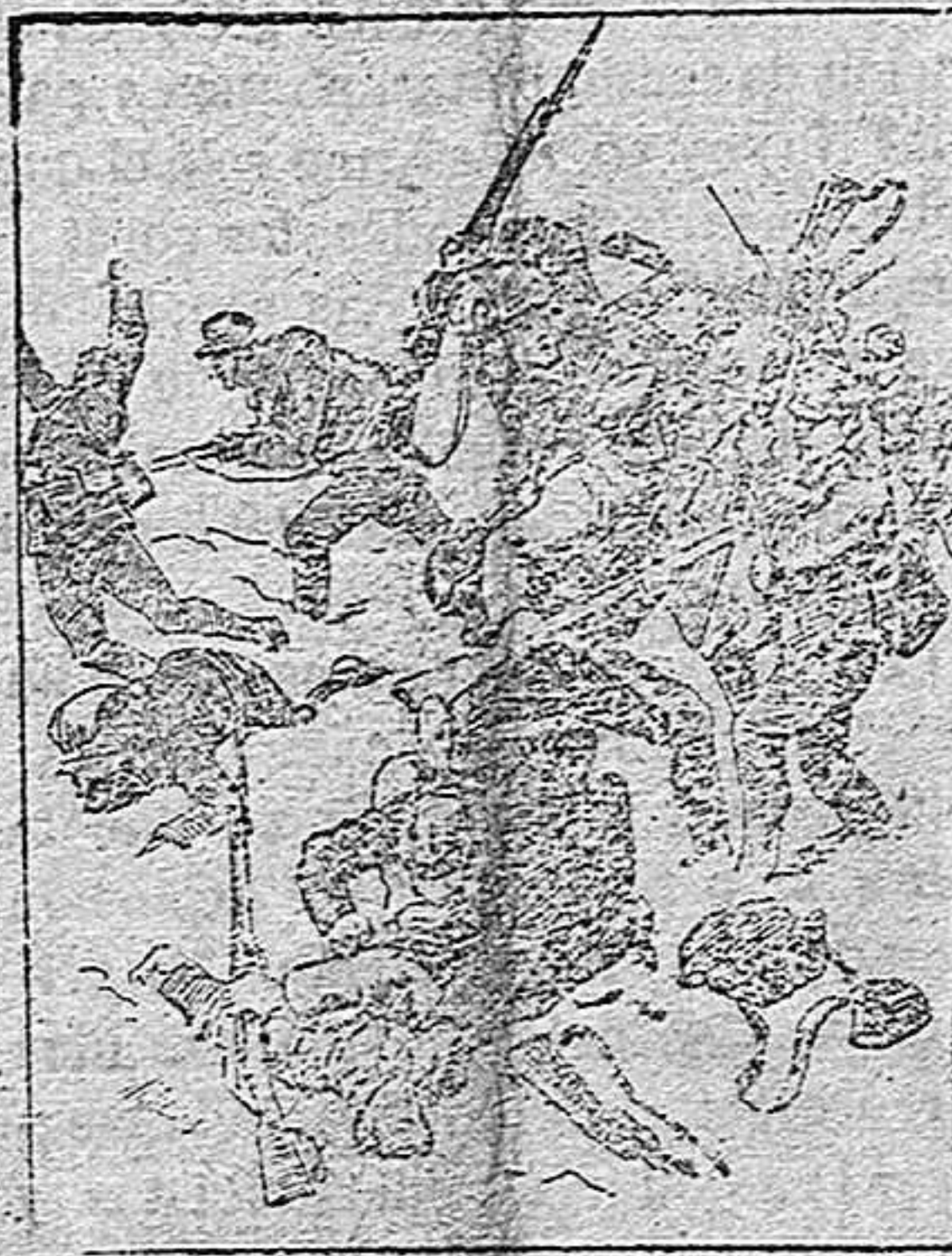
Un cuerpo a cuerpo entre soldados austríacos e italianos en Monte Colón.