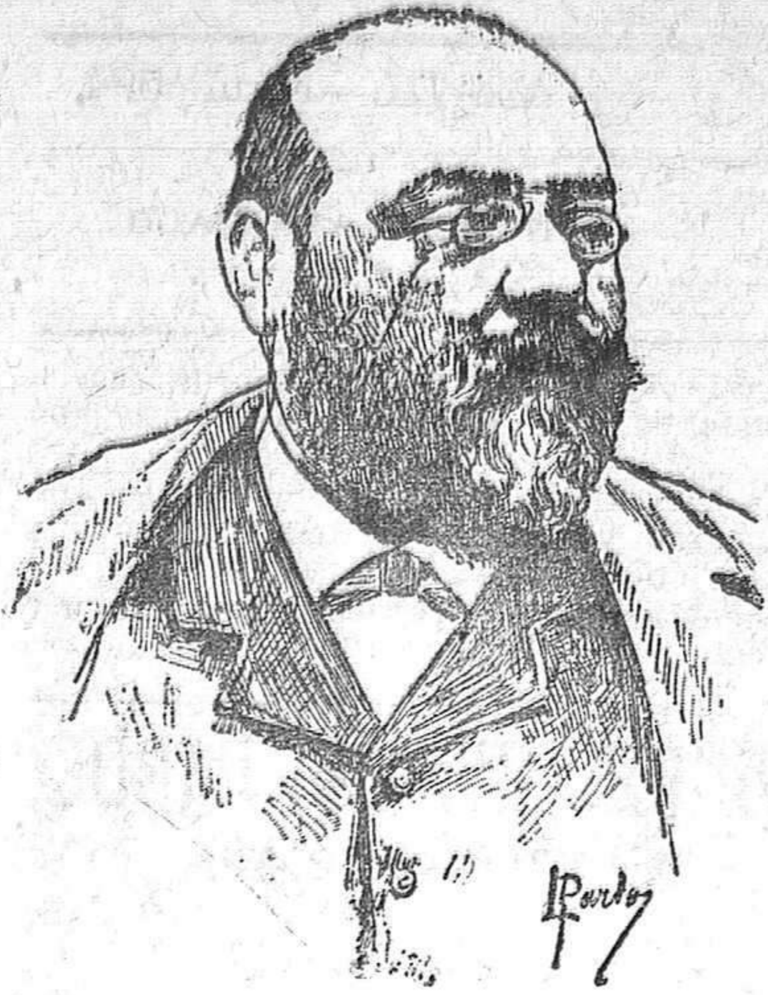
Lo que dice la prensa

Comedia en tres actos y en prosa, de D. José Feliu y Codina. Estrenada con gran éxito en el teatro Español de Madrid.