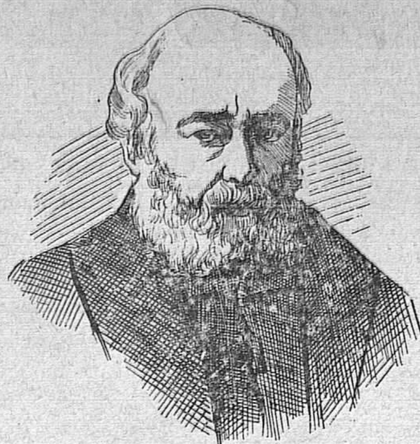
Lord Salisbury, primer ministro inglés

Con motivo de la posesión de un territorio situado en los límites de Venezuela, que Inglaterra pretende, entre esta nación y los Estados Unidos, surgió hace dias el conflicto hoy pendiente, la solución del cual preocupa mucho á todos los pueblos de Europa y América.