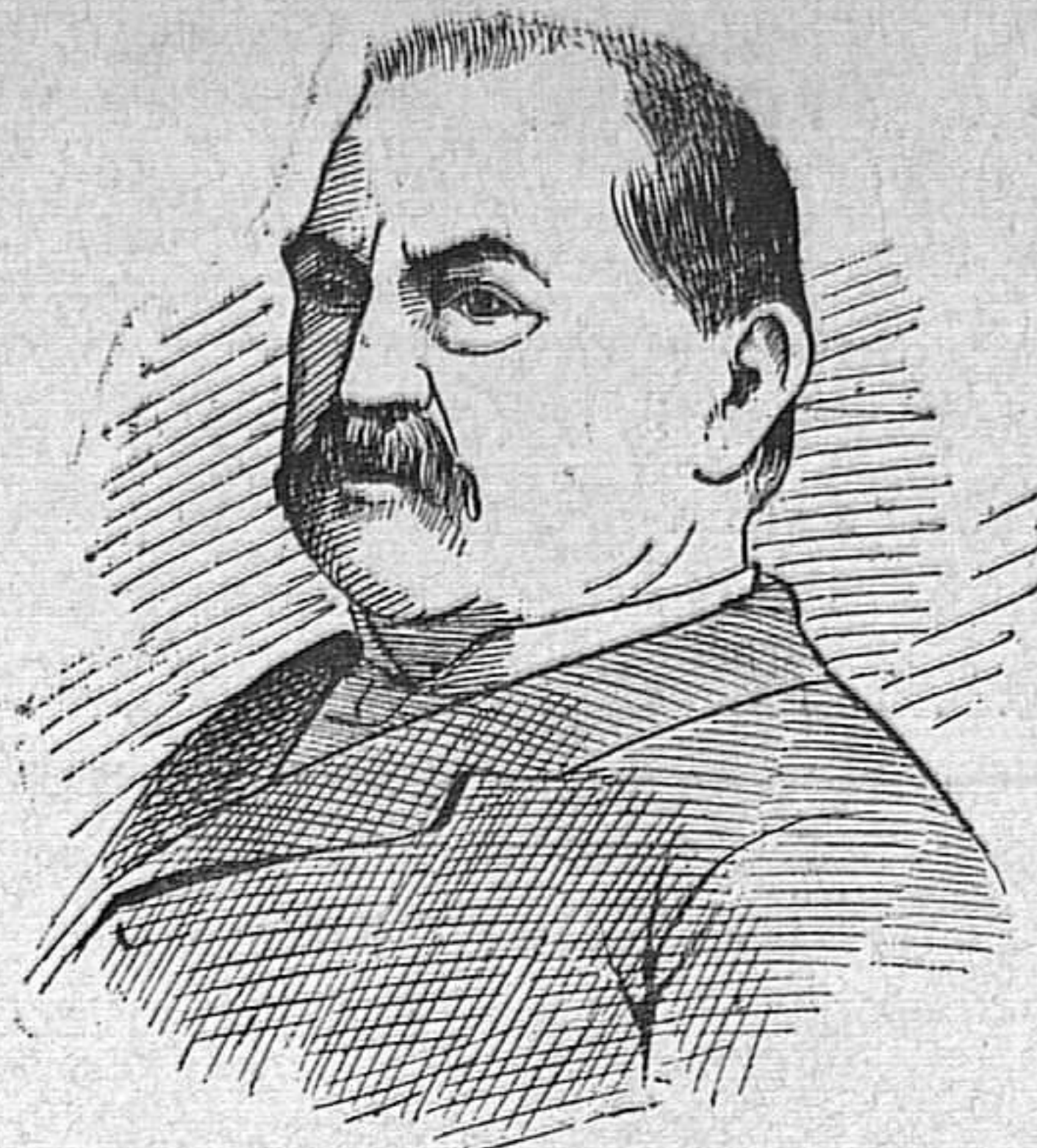
Mr. Cleveland, presidente de la República de los Estados Unidos

Con motivo de la posesión de un territorio situado en los límites de Venezuela, que Inglaterra pretende, entre esta nación y los Estados Unidos, surgió hace dias el conflicto hoy pendiente, la solución del cual preocupa mucho á todos los pueblos de Europa y América.