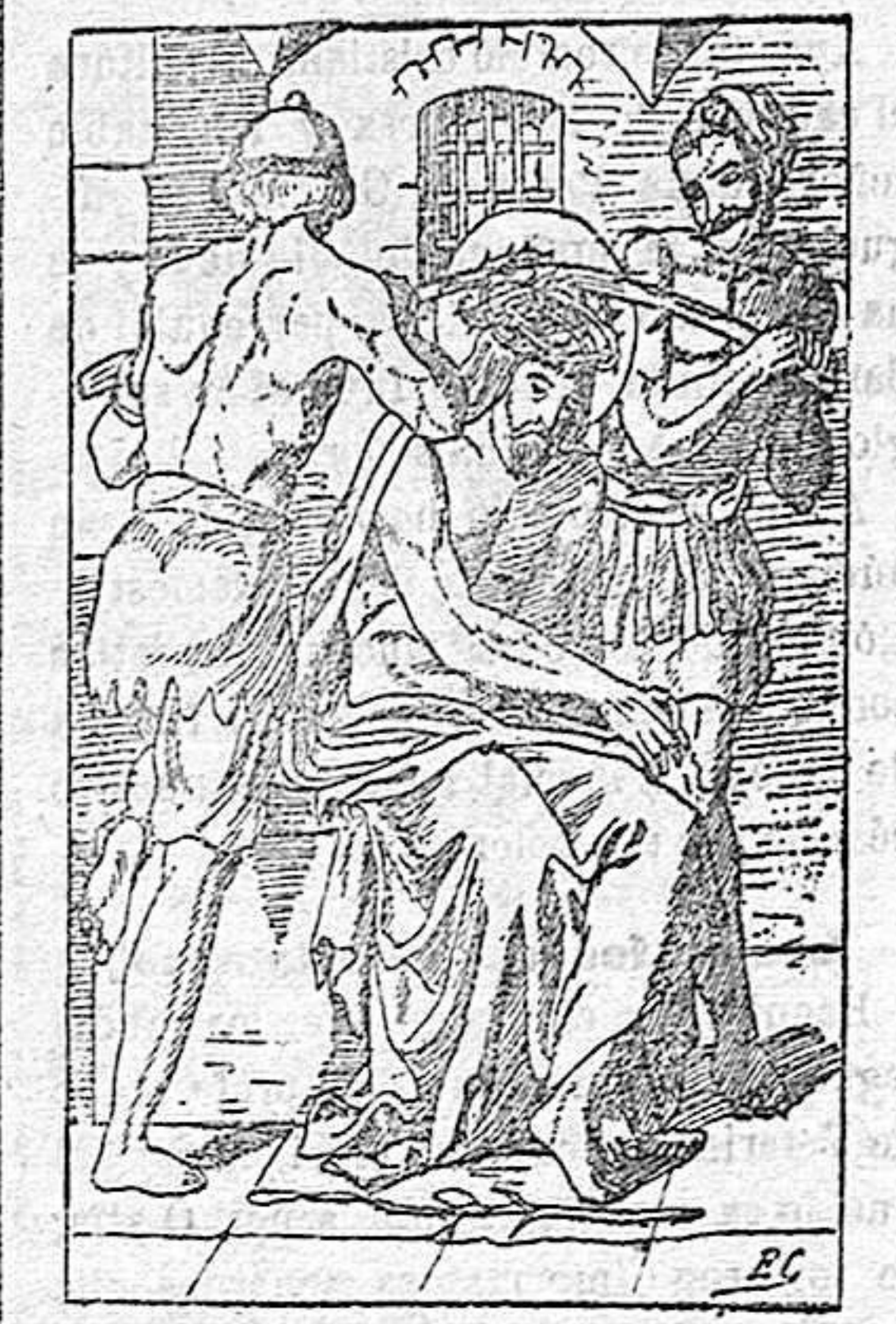
La Pasión del Señor. Reproducción de un antiguo grabado en cobre.

agrestes, primaverales prados, rocas desgarradas, parleras aves, estrella-dos cielos, murmurantes arroyos, embriagantes aromas, elocosas flores, tierras, mares, astros, ángeles del paraíso, almas, almas todas de los hombres, hombres todos de este valle de miserias, amad á mi Jesús, consolad á mi Jesús, acompañad á mi Jesús. ¡Está tan solo! ¡Y está tan triste! Alma mía, anégate en los amores divinos. Sea tu vida un beso de amor.