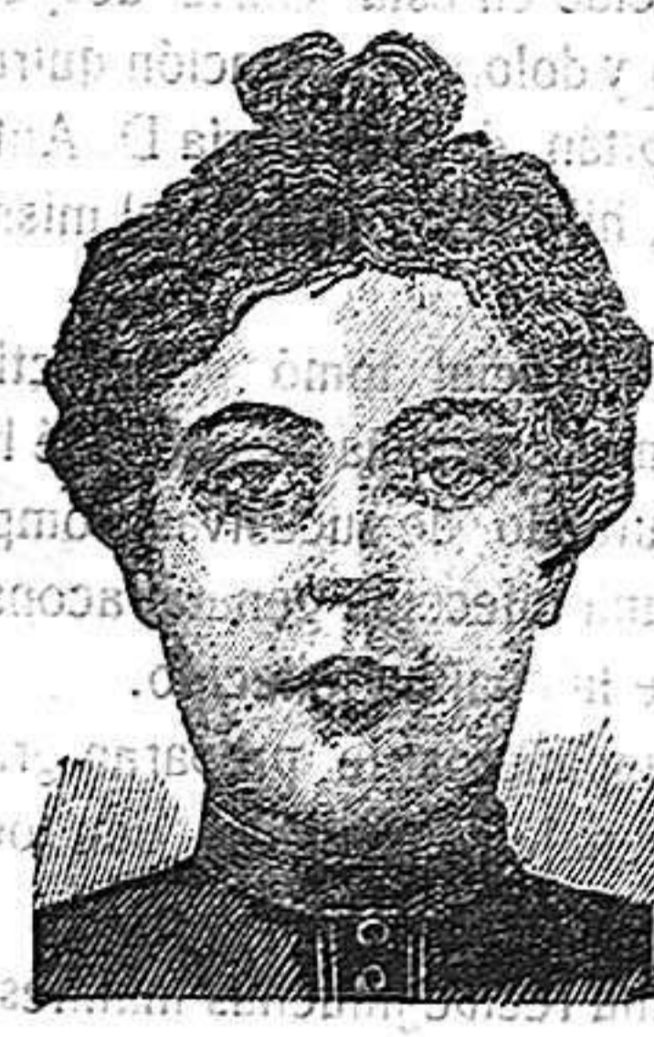
15 días después de tratamiento