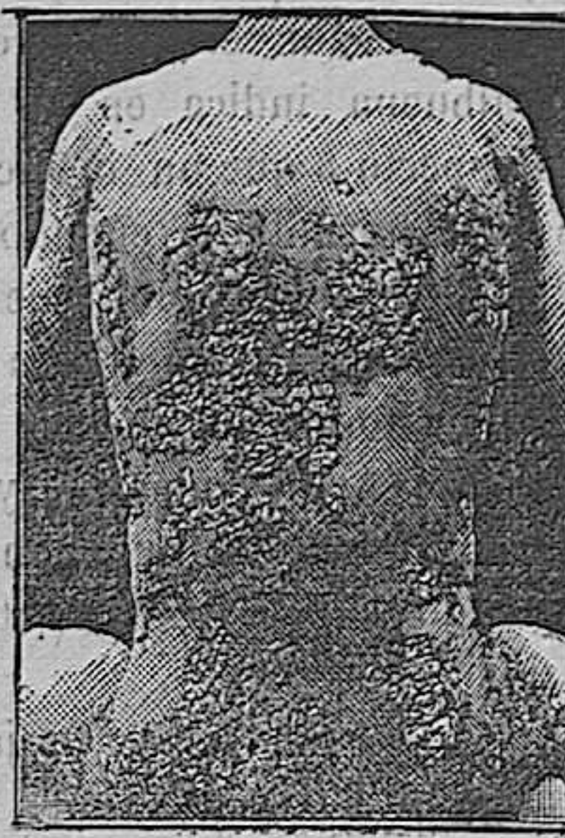
Antes de la curacion