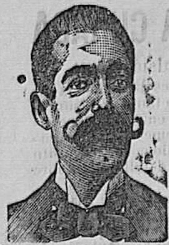
A. SALVATI COSTANZI Calle Diputación, 435 BARCELONA.