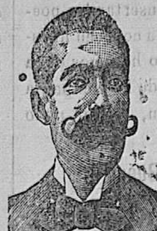
A. SALVATI COSTANZI Calle Diputación, 435 BARCELONA.

Todas estas maquinas están prontas para expedir — Envío franco de los prospectos detallados. CASA J. HERMANN-LACHAPPELLE J. BOULET y Cia , SUCESORES, INGENIEROS MECANICOS 31-33, rue Boineod (B d Ornano, 4 y 6) PARIS, antes F o Poissonnière, 144