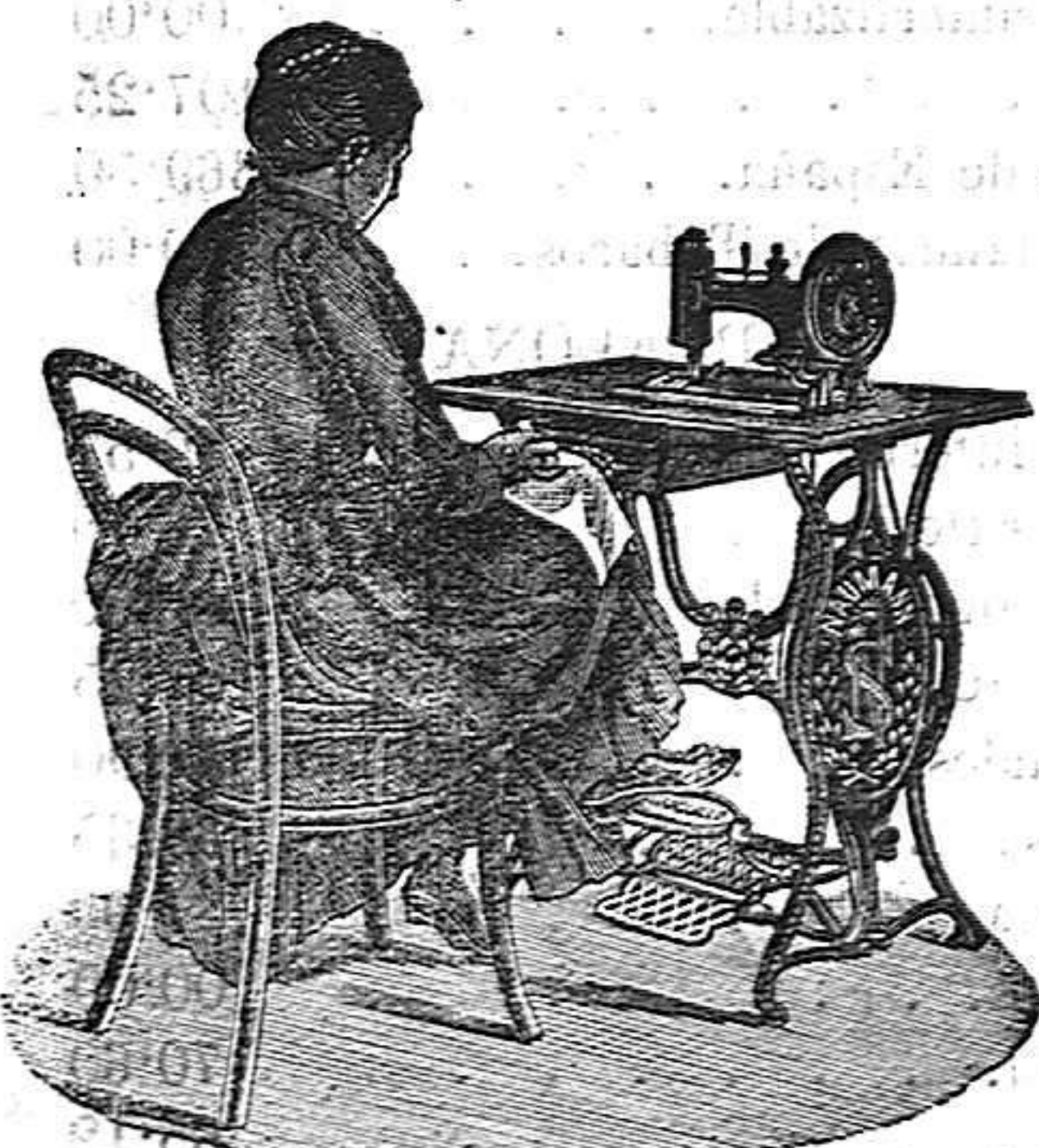
Nuevo, Práctico Higiénico