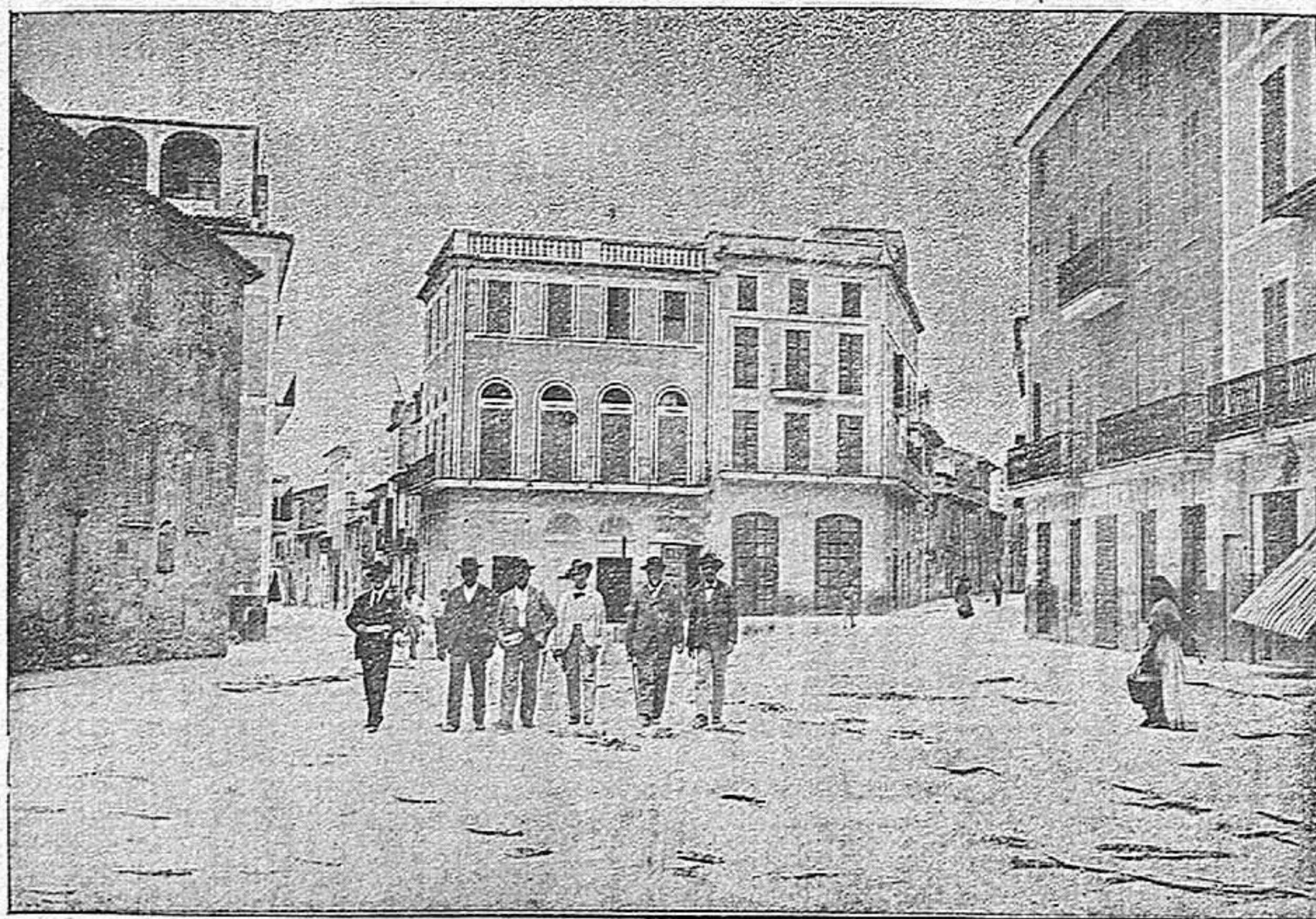
PLAZA DE LA Balsa

Celebra un mercado semanal todos los lunes, y