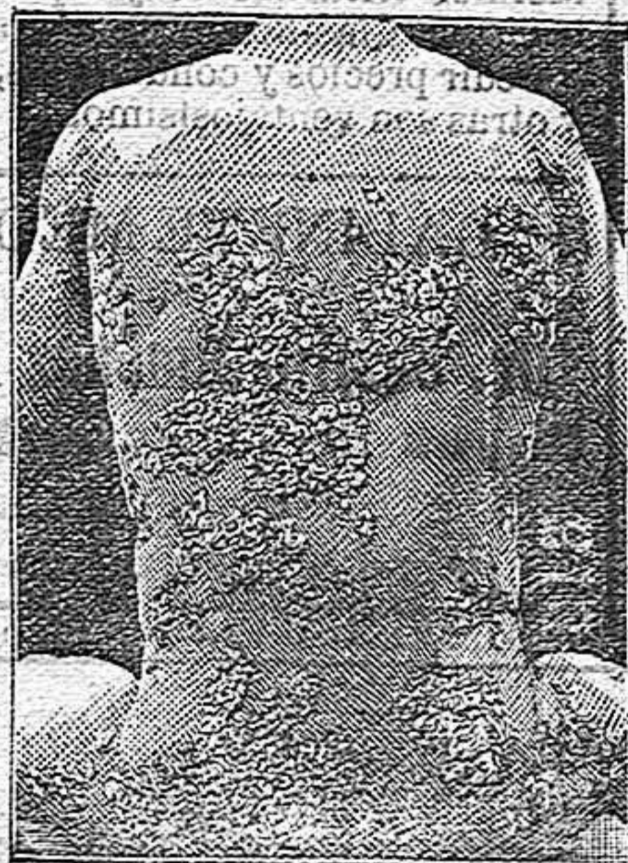
Antes de la curación.