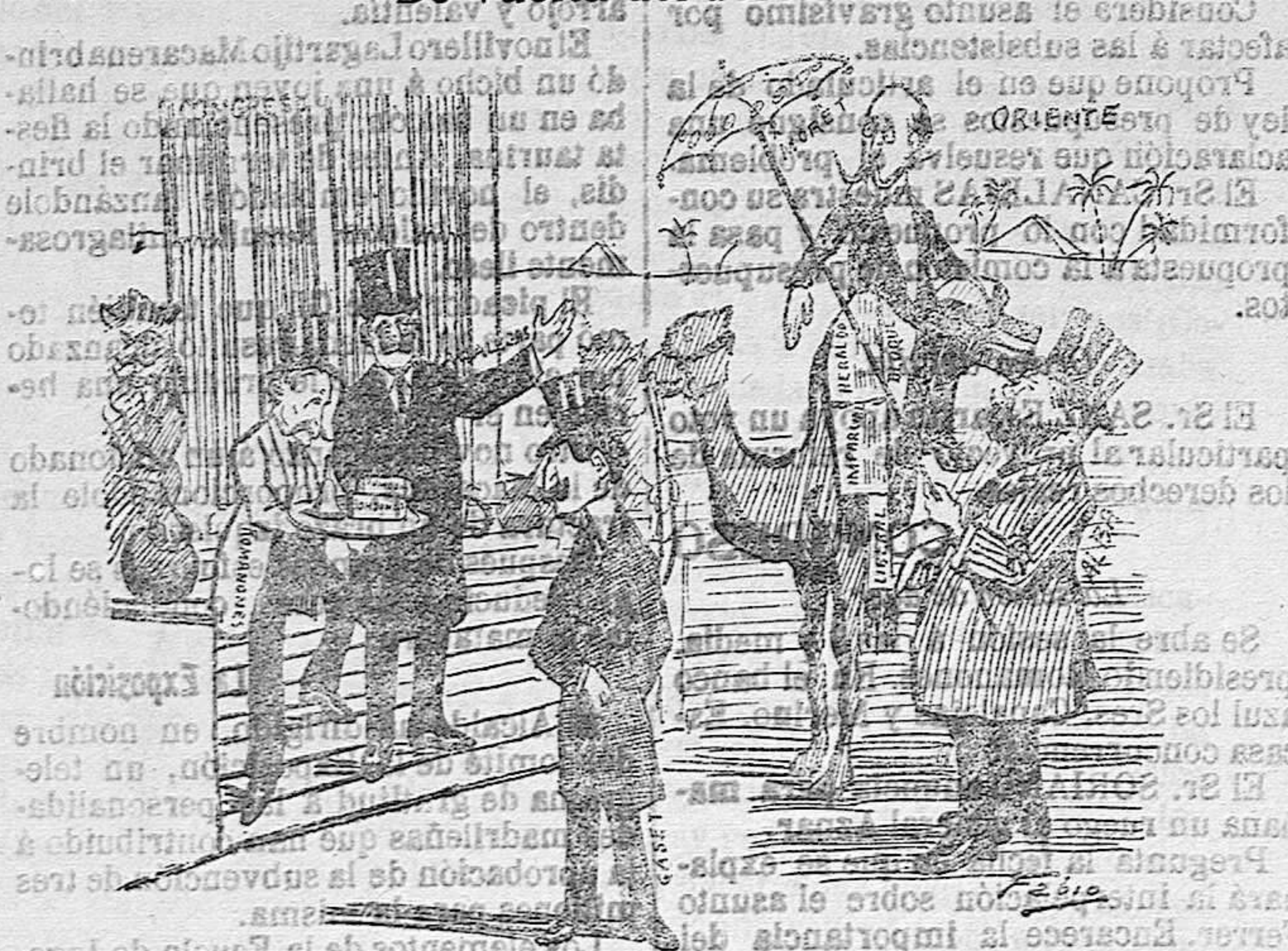
Canalejas: «Pero no habíamos quedado en que D. Segis se quedaba en el desierto? Romanones: —Es que en el desierto no hay más que arena....»