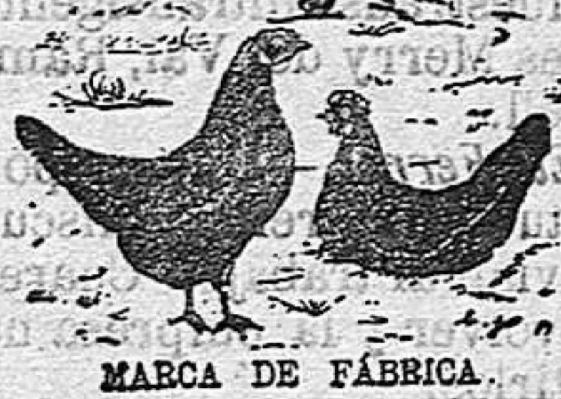
MARCA DE FÁBRICA REGISTRADA

Rogamos a todos nuestros lectores propaguen entre el público las condiciones que ofrecemos y lean el «Aviso importante» de 4.ª plana.