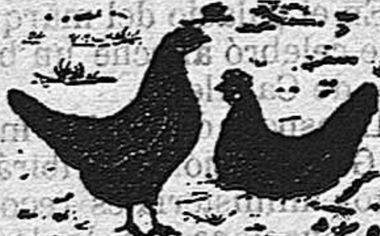
MARCA DE FÁBRICA REGISTRADA

Rogamos á todos nuestros lectores propaguen entre el público las condiciones que ofrecemos y lean el «Aviso importante» de 4.ª plana.