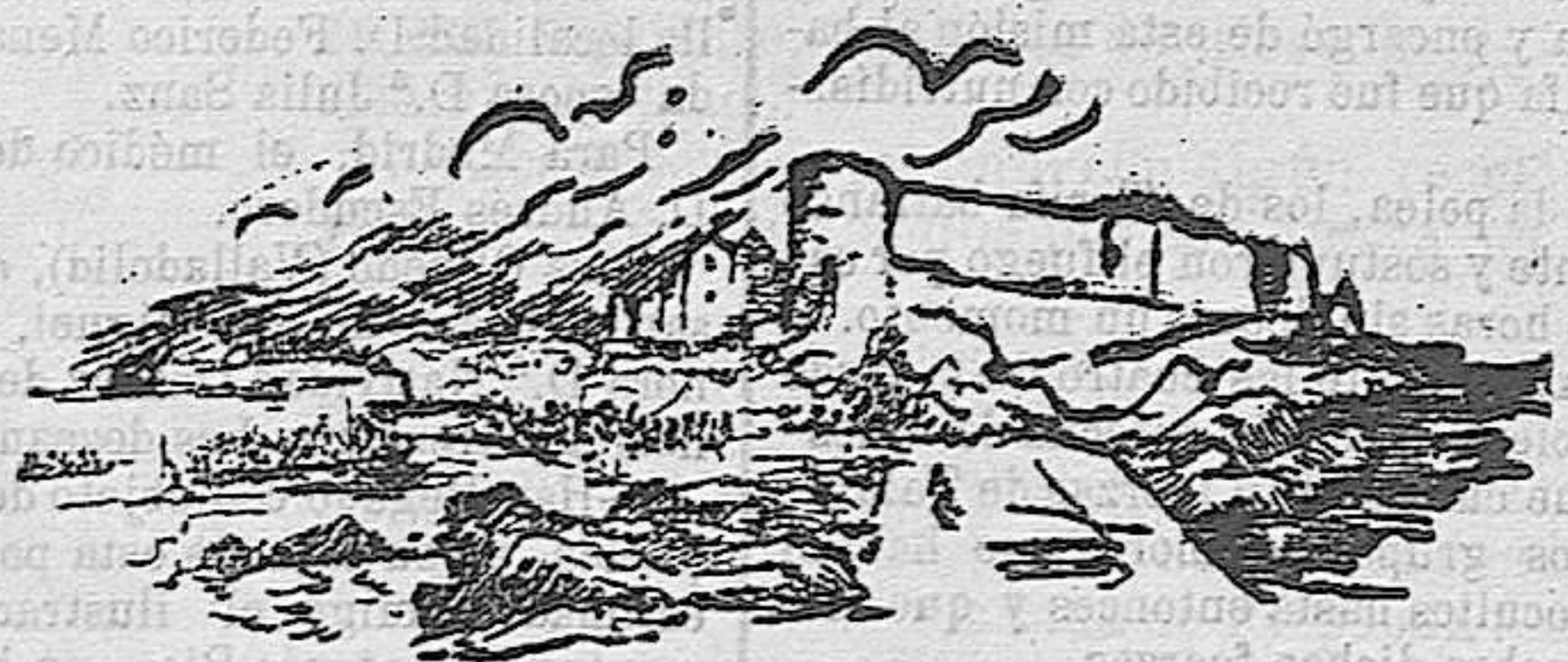
FORTIFICACIONES MARÍTIMAS EN

Divagaciones de un soldado en campaña, durante la noche.