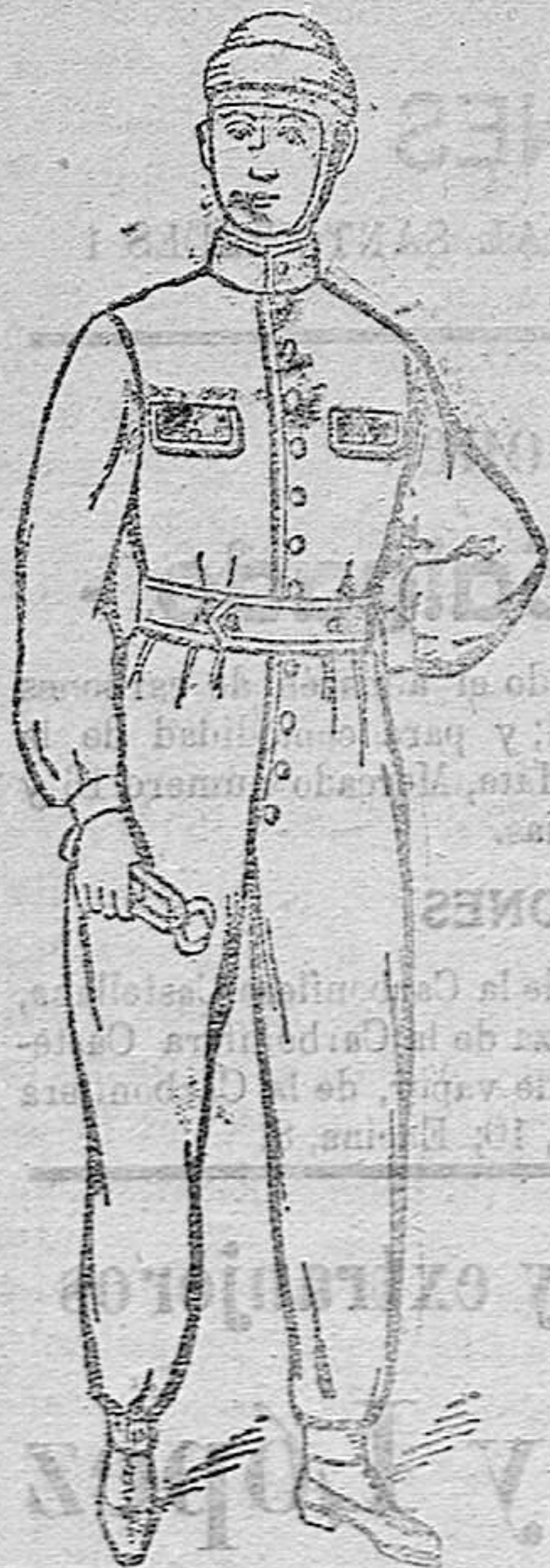
TRAJES COMPLETOS propios para mecánicos y motoristas en azules, a 17 y 20 pes. 1.ª y en lana im. en verde a 18, 20 y 25 pes.

Esta casa acaba de recibir nuevas remesas de gabanes de caballero y jóvenes, abrigos de señora y niñas, pellizas, capos, mantas de Palencia y mantones. Gran surtido en impermeables para militar y paisano.