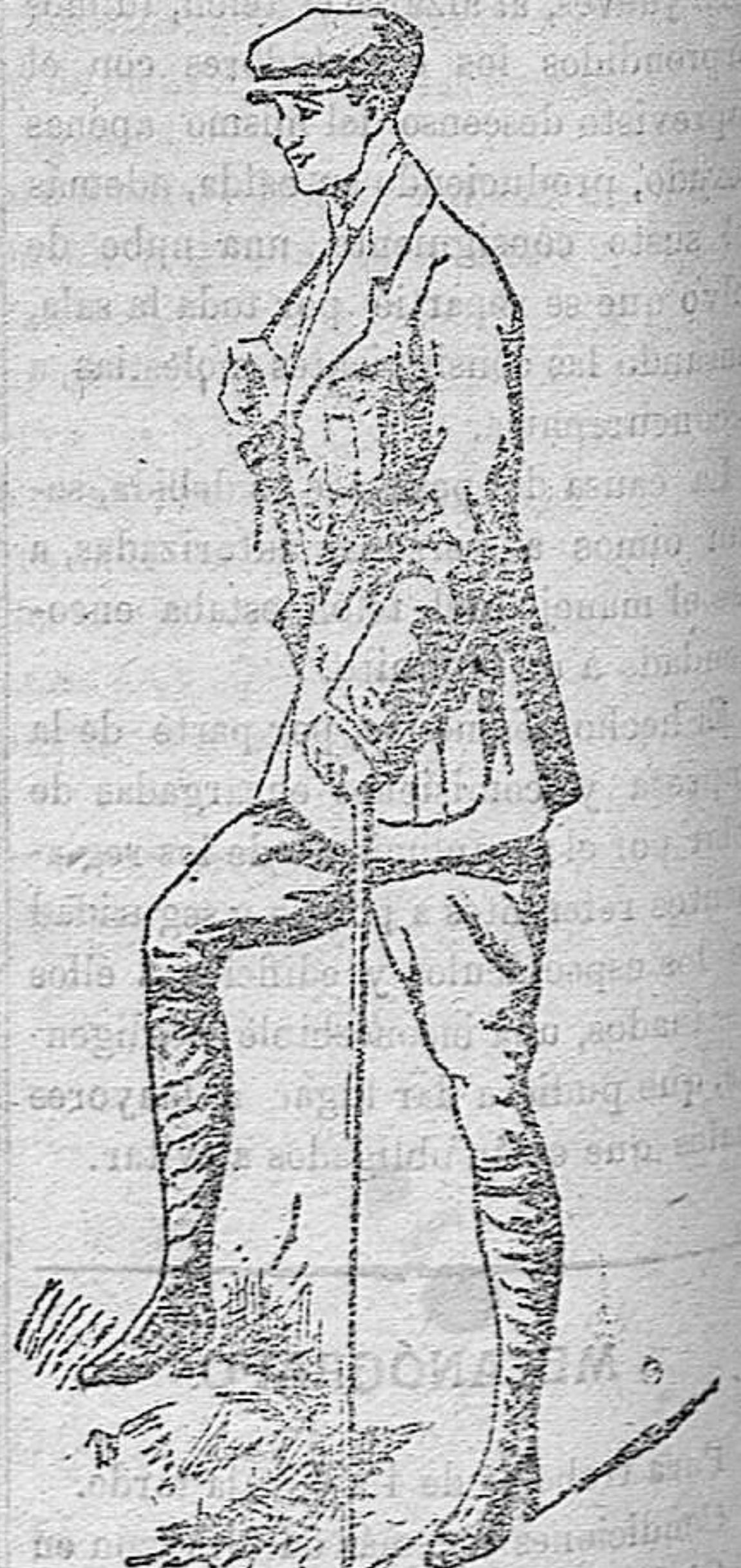
TRAJES COMPLETO ESPORT