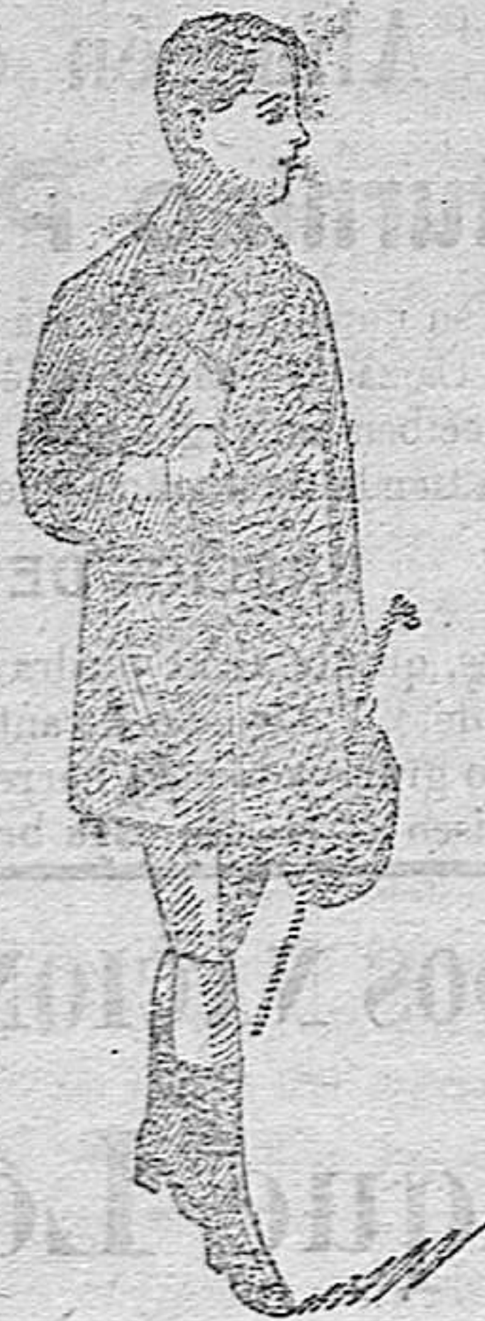
GABANES para niños y jovencitos a 20, 25 y 30 pes.