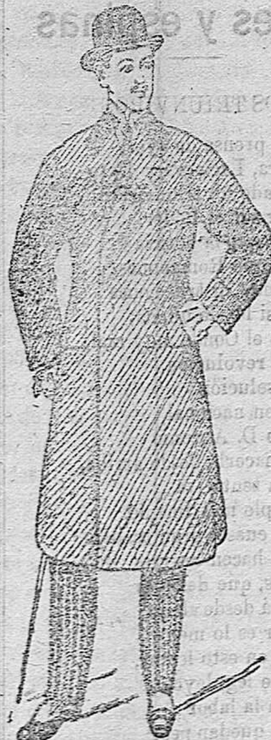
GABANES DE CABALLERO Últimas novedades a 45, 50, 60, 80, 90, 100 y 125 pes.