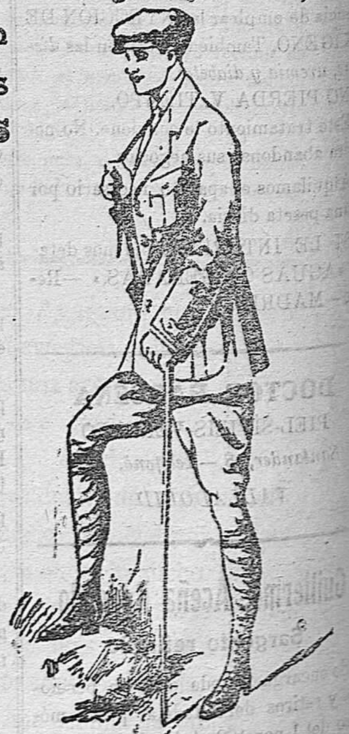
MODELOS DIFERENTES de niño, en Paño, Gergas y Panas a 9 pesetas, 12, 15, 20 y 25 ptas.