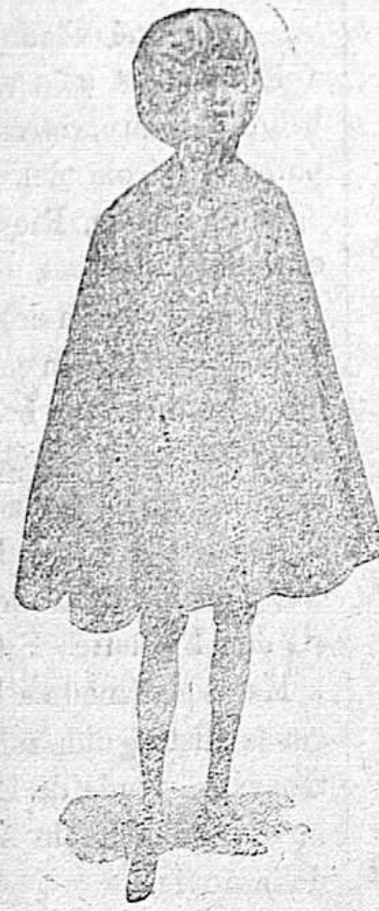
CAPITAS IMPERMEABLES para niños y niñas desde pesetas 9 a 20

Impermeables Gabardina y fuertes para el campo.