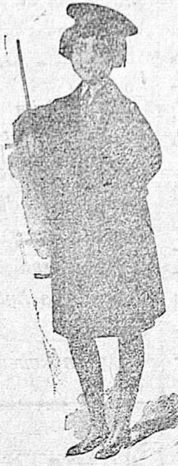
MATELOS Y GABANES; para niños desde pesetas 12 a 40

Guardapolvos para caballero, señora y niños. Enterizos y Cascos para motoristas.