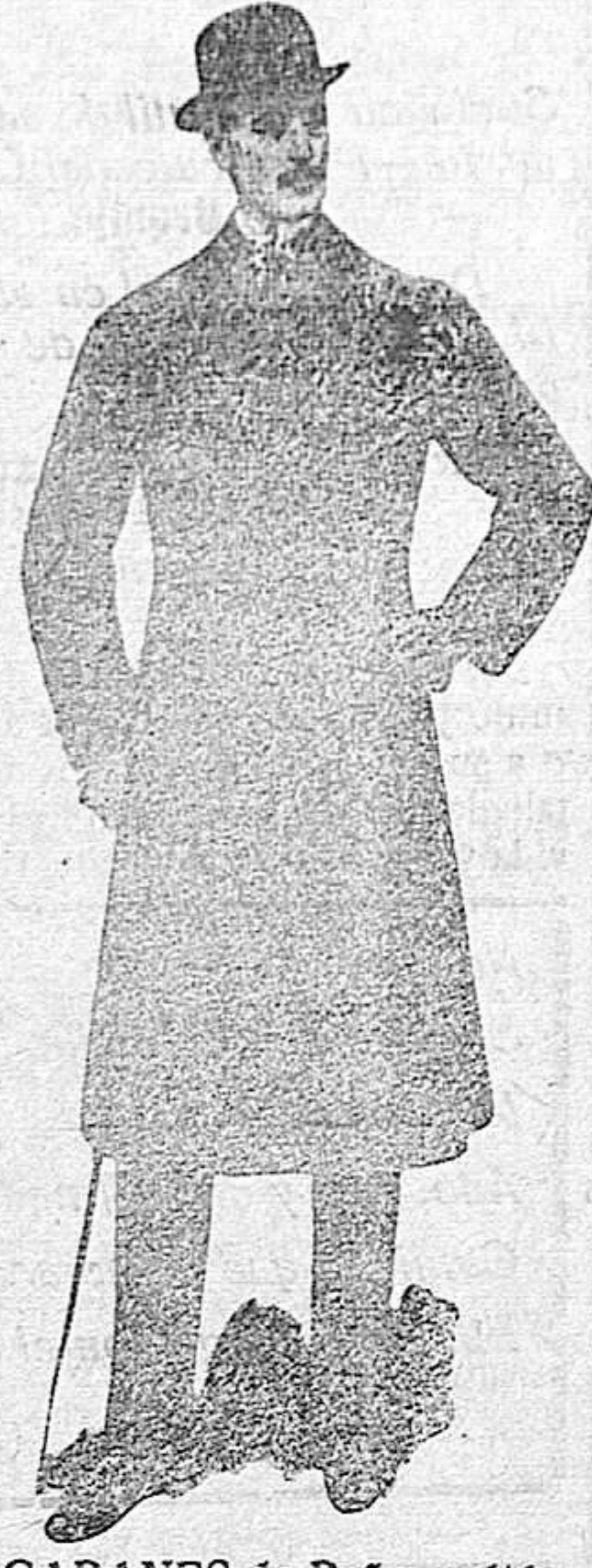
GABANES de Paño meltón a 80 ptas.

Casa de Tejidos y Confecciones de Caballero Señora - y - niños