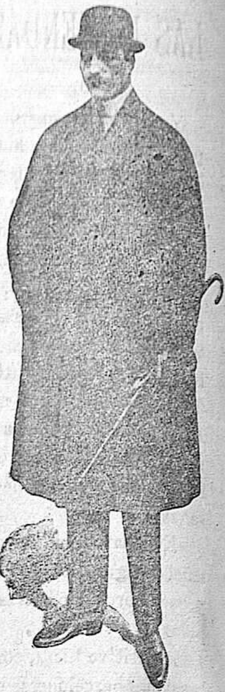
GABANES de 30 a 100 ptas.

Camisería corbatería Cuellos Puños cauchut, plancha - y - piqué