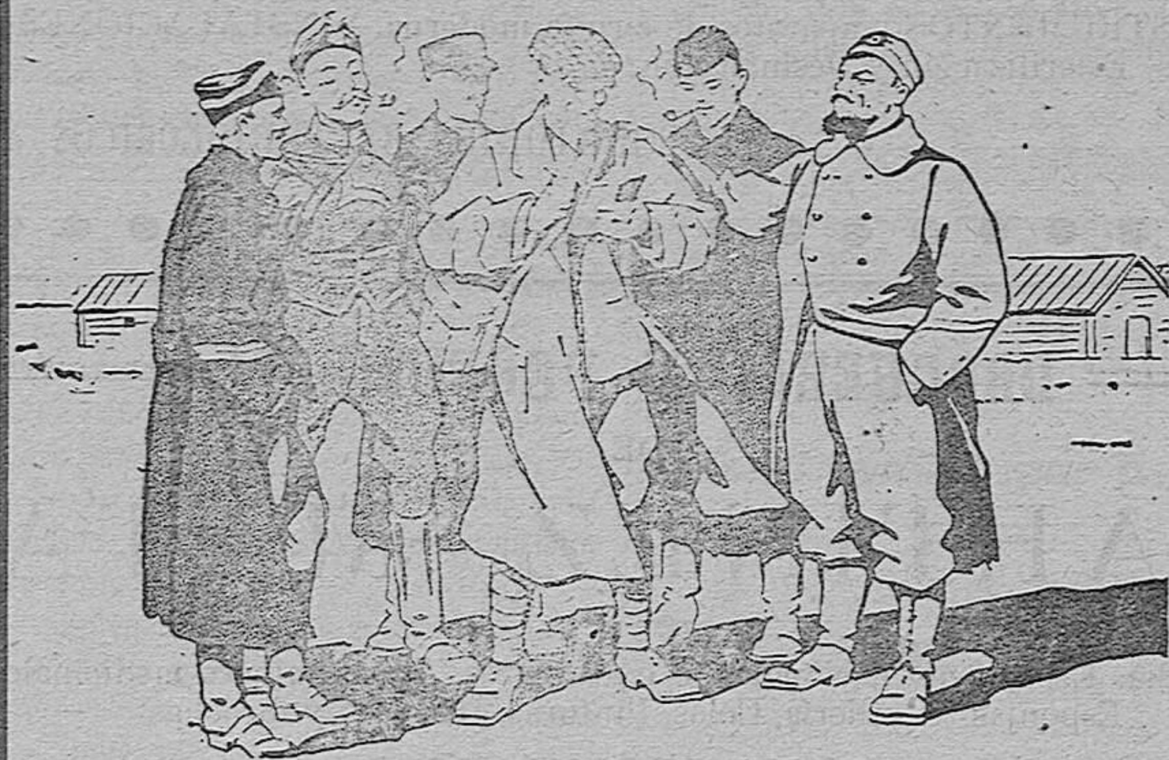
M. W*** reporter holandés interrogando a los prisioneros del campamento de Harderwyk.

Sabido es que después de luchar heroicamente contra el invasor, sucumbiendo bajo el número después de luchar uno contra veinte, algunas tropas belgas evitaron el caer prisioneras pasando la frontera y refugiándose en Holanda. Conforme a las leyes internacionales estas tropas fueron internadas en campamentos, particularmente en el de Harderwyk. Entre estos soldados había muchos que si bien no estaban heridos se encontraban muy quebrantados de salud, a consecuencia de las fatigas de la campaña y también como resultado del choque moral sufrido. Han sido atendidos con esmero y se han restablecido por completo. Hemos tenido una gran satisfacción al saber que muchos se han curado merced al tratamiento por las Píldoras Pink, que en Holanda disfrutaban de tanto favor como en España.