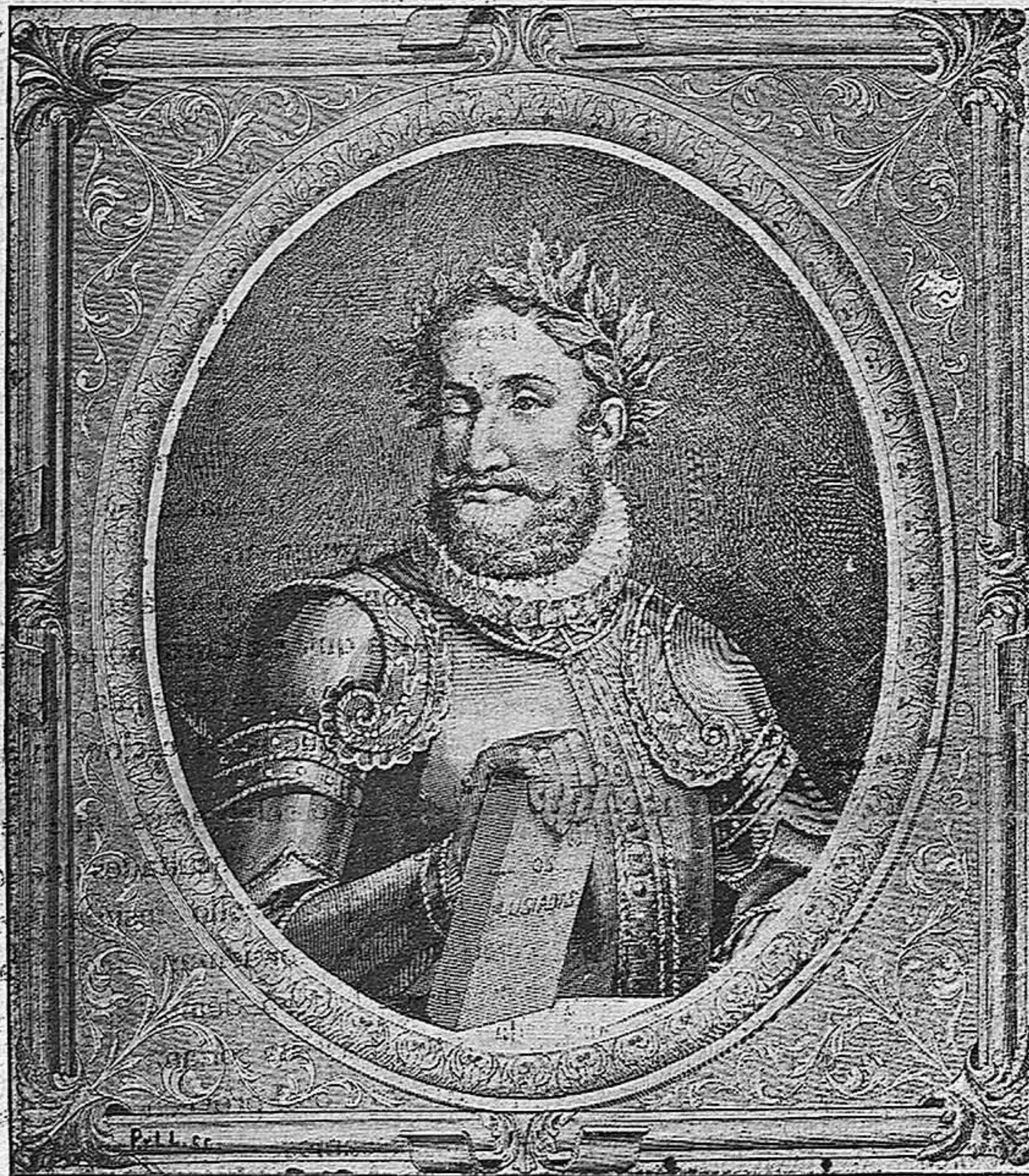
LUÍS DE CAMOENS

Si la bárbara ley de la antigua Grecia que obligaba á la madre á sacrificar á los hijos que no nacieran dotados de la belleza física que endiosaba aquel pueblo de artistas plásticos, que con saña salvaje despreciaba al que tenía algún defecto físico, no se hubieran salvado de sus iras muchos de los que han asombrado al mundo con sus creaciones.