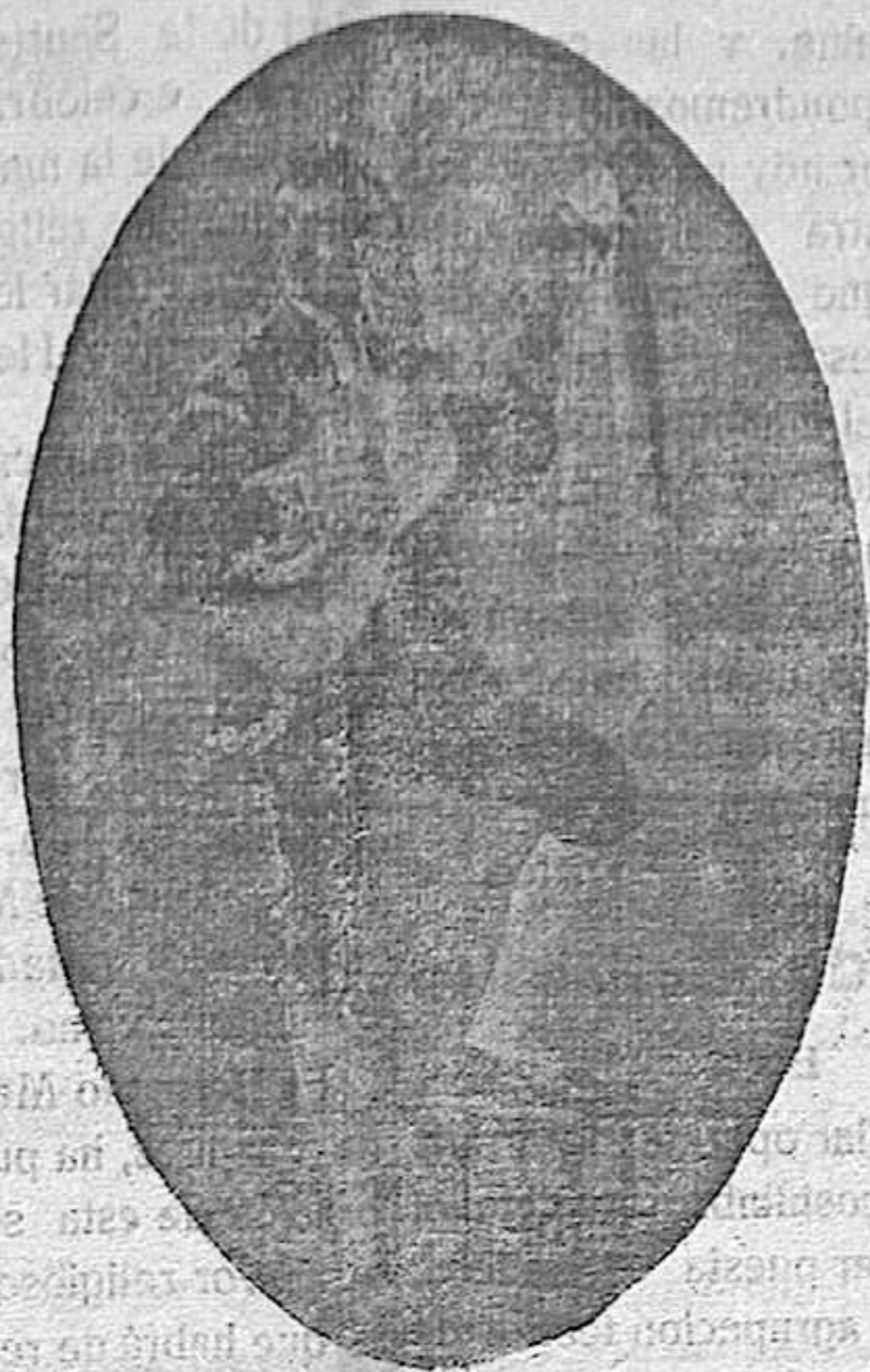
El eminente baritono manchego Marcos Redondo Valencia, que anoche se presentó al público de Ciudad-Real, cantando la Cavatina del Barberi de Siviglia, una de sus creaciones mas portentosas, no superadas por ningún artista, y en la que ha conquistado uno de los primeros puestos en el arte lírico.